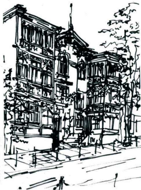
Rys. 2. Stylizowana architektura z I połowy XX wieku – Łazienki Południowe (arch. Puchmuller), kamienica czynszowa z werandami na ul. Grunwaldzkiej