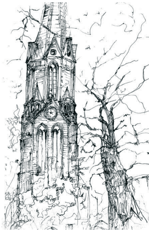
Rys. 3. Relikt dawnego kurortu, powojenny klub EMPIK-u, zburzony w 2003 roku. Wieża kościoła św. Jerzego na placu w centrum miasta