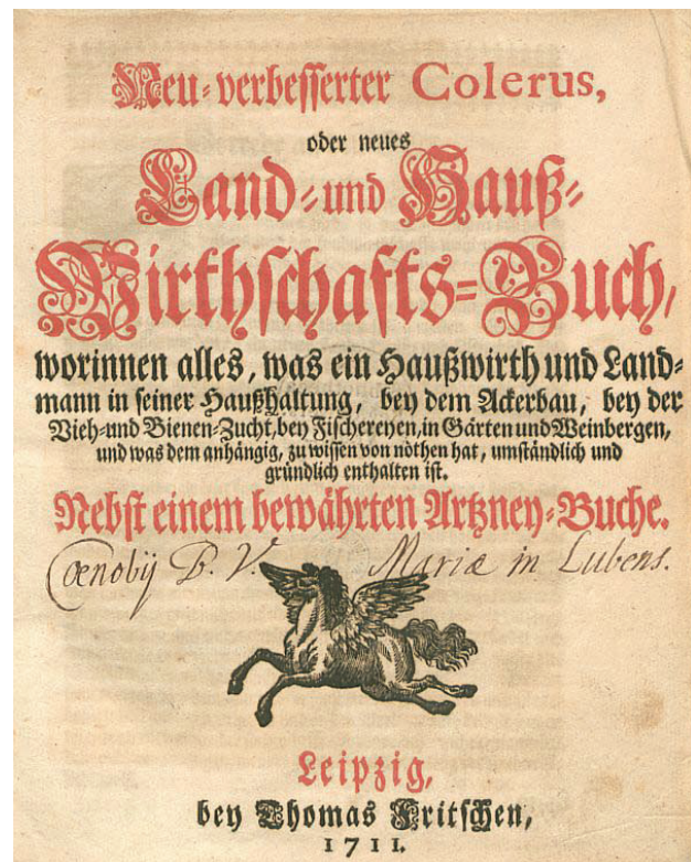
Il. 1. Strona tytułowa poradnika Neu-verbesserte Colerus z inskrypcją własnościową klasztoru w Lubiążu (Biblioteka Uniwersytecka we Wrocławiu, Oddział Starych Druków, sygn. 902298)

Most of these works were written in German, or they were translated into this language but were originally treatises written in Latin, Italian and French. For example, a treatise on agronomy by Pietro de Crescenzi was published in Latin in 1538 in Basel [8]. There are also two examples in Italian of the same text, one published in Venice in 1542, the other published in Florence in 1605.