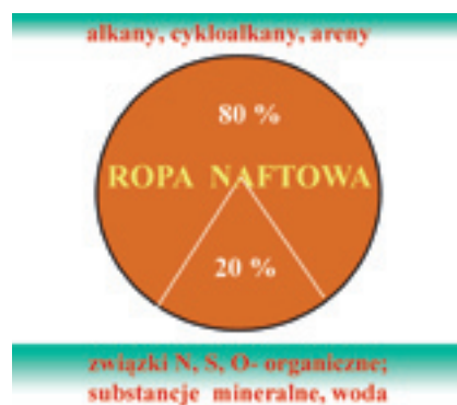
Rys. 3. Główne składniki ropy naftowej

Ropa naftowa w procesie technologicznym daje się rozdzielić na poszczególne frakcje o przedstawionych w tabeli 1. – charakterystyce i zastosowaniu.