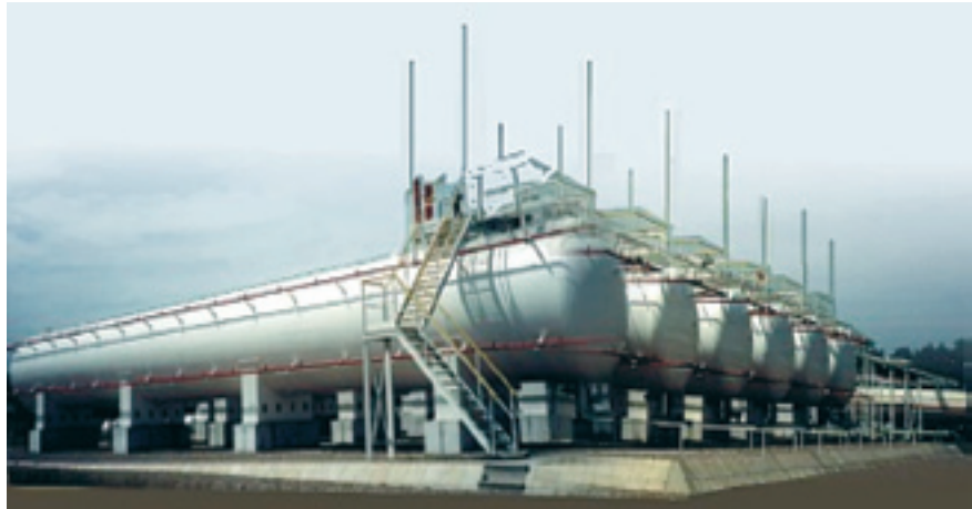
Fot. 1. Zbiorniki do magazynowania LPG

farbami odbłaskowymi nagrzewają się w znacznie mniejszym stopniu. Stąd wniosek, że zbiorniki na produkty naftowe gazowe i ciekłe najlepiej malować farbami białymi lub metalizowanymi, np. aluminiowymi.