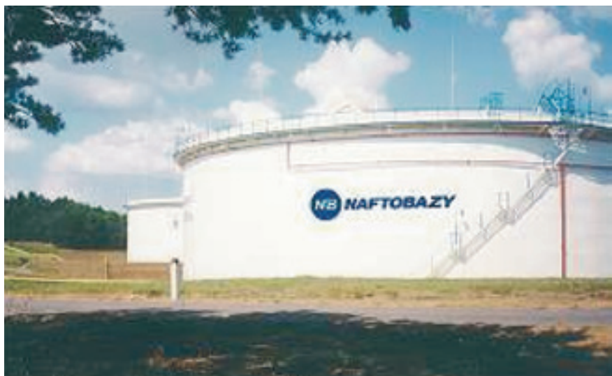
Fot. 2. Zbiorniki do magazynowania ciekłych węglowodorów

Transport większych ilości ropy i produktów odbywa się cysternami kolejowymi, zbiornikowcami lub rurociągami. Cysterny kolejowe mają zazwyczaj pojemność 30 ÷ 75 m 3 . Powinny być wykonane ze stali o odpowiedniej grubości, z zamontowanymi wewnątrz przegrodami zapobiegającymi falowaniu cieczy w trakcie transportu, a jednocześnie