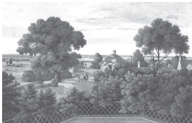
Rys. 5. Zespół zabudowań „Dom Angielski”, rycina z początku XX wieku, NID

Zabezpieczenie reliktyw budynku miało wówczas polegać na ekspozycji dawnego obrysu ścian przez ich nadbudowę do wysokości 40 cm. Zachowane fundamenty i ściany fundamentowe, wykonane jako ławy murowane z cegły pełnej palonej na zaprawie wapiennej, miały być pozostawione w stanie nienaruszonym. Zaprojektowano nadbudowę istniejących ścian ścianami murowanymi z cegły pełnej klasy 15 na zaprawie wapienno-cementowej o grubości 38 cm, wysokości 40 cm, a na projektowanych ścianach zaproponowano wykonanie kilku ławek z drewna sosnowego klasy C30 z elementów o przekroju 30x60x480 mm układanych w kierunku poprzecznym. W obrębie projektowanych ścian projekt zakładał wykonanie podbudowy pod nawierzchnię trawy wraz z odwodnieniem wnętrza obrysu ścian na teren przyległy [2].