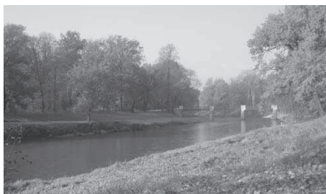
Rys. 1–4. Park Mużakowski dzisiaj