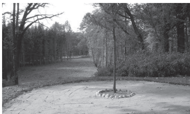
Rys. 9. Odtworzony fragment alei spacerowych

w Parku Mużakowskim, pozostałe są porośnięte trawą. Zaprojektowany układ ścieżek zakłada odtworzenie brakujących fragmentów historycznego układu oraz modernizację zachowanych alei spacerowych, a oparty jest przede wszystkim na zasobach ikonograficznych, przede wszystkim planie – mapie wykonanej w XIX wieku.