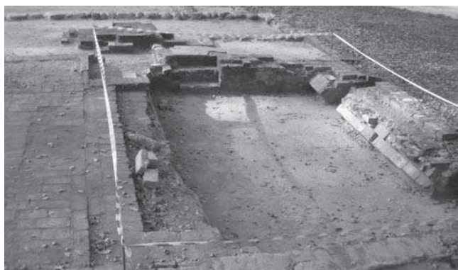
Rys. 6–7. Prace podczas realizacji projektu zabezpieczenia reliktyw budynku głównego zespołu „Dom Angielski”

Narodowy Instytut Dziedzictwa podjął decyzję odbudowy zespołu obiektów „Dom Angielski” wraz z odnowieniem ścieżek. Prace dotyczące budynku głównego miały obejmować zabezpieczenie zachowanych reliktyw po ich odsłonięciu spod warstwy trawy i humusu. Projekt został wykonany jedynie na podstawie materiałów archiwalnych i kilku odkrywek wykonanych przez archeologów.