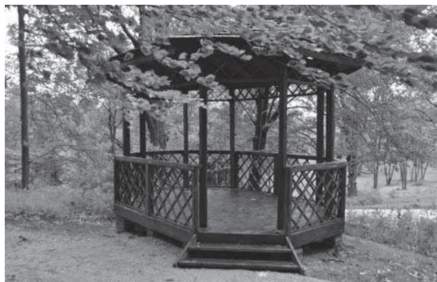
Rys. 8. Pawilon muzyczny zrealizowany zgodnie z projektem rekonstrukcji

Pierwotny układ ciągów pieszych zespołu „Dom Angielski” zachowany jest fragmentarycznie, istniejące aleje spacerowe funkcjonują jako odcinki głównych ciągów komunikacyjnych