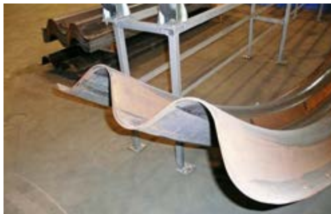
Ryc. 3. Przykładowy widok elementu konstrukcyjnego typu SuperCor® w fazie produkcji. Widoczna wysokość fali charakterystyczna dla tego typu przekroju

Przykładowy widok elementu konstrukcyjnego typu SuperCor® przedstawiono na rycinie 3.