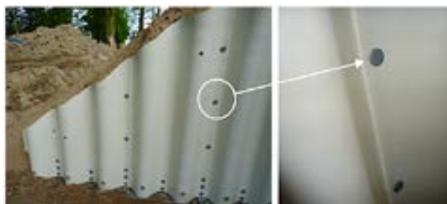
Ryc. 6. Przykładowy widok połączenia poszczególnych segmentów blach od wewnątrz konstrukcji przejścia dla pieszych w trakcie realizacji. Widoczne trzpienie śrub zlicowane z powierzchnią blach konstrukcyjnych, fot. A. Wysokowski

Na rycinie 5a i 5b przedstawiono przykładowy schemat oraz widok połączenia poszczególnych segmentów blach.