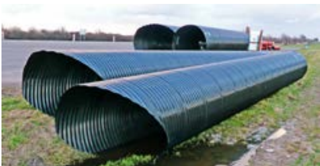
Ryc. 2. Widok konstrukcji powłokowych z rur spiralnie karbowanych. Widoczne ukształtowane na etapie produkcji skosy wlotu i wylotu przepustu, zgodnie z projektowym nachyleniem skarpy

Przykładowy widok konstrukcji powłokowych z rur spiralnie karbowanych zabezpieczonych powłoką polimerową przedstawia rycina 2.