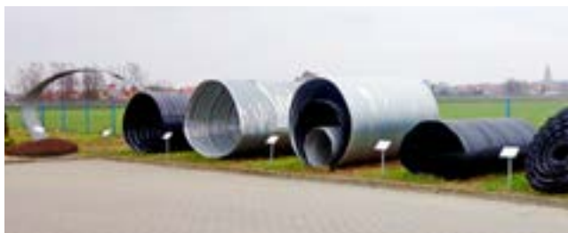
Ryc. 1. Przykładowy widok rodzajów rur osłonowych z blach falistych stosowanych do budowy obiektów gruntowo-powłokowych

Wieloletnie doświadczenia wynikające ze stosowania konstrukcji z blach falistych pokazują, że konstrukcje o kształcie łukowym oparte na fundamentach są bardziej ekonomiczne od konstrukcji o kształcie zamkniętym, przy rozpiętości powyżej 8,0 m. Warunkiem koniecznym jest jednak występowanie dobrych warunków gruntowych i związanych z tym relatywnie niskich kosztów posadowienia konstrukcji. Popularne w przypadku budowy małych mostów i przepustów konstrukcje oparte na fundamentach pozwalają na minimalną ingerencję w środowisko naturalne, nie naruszając dna cieków, nad którymi przechodzą [6].