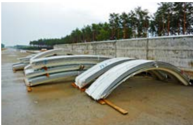
Ryc. 4. Widok segmentów blach o dużej korugacji na placu budowy konstrukcji przejścia dla zwierząt o dużej rozpiętości

Natomiast konstrukcje UltraCor® należą do najnowszej generacji konstrukcji podatnych z blach falistych o największym dotychczas stosowanym profilu fali. Dzięki temu łączą w sobie wszystkie zalety lekkich konstrukcji z nieznaną dotąd wytrzymałością i trwałością. Pozwala to na budowanie obiektów podatnych o rekordowych rozpiętościach [11].