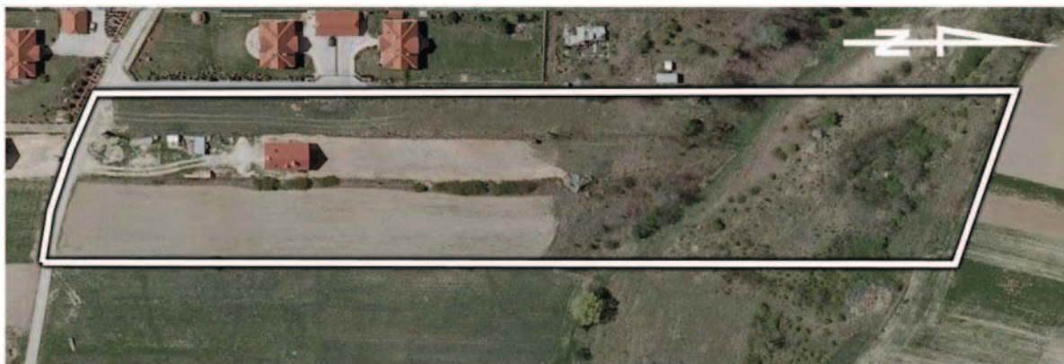
Rys. 1. Pole testowe