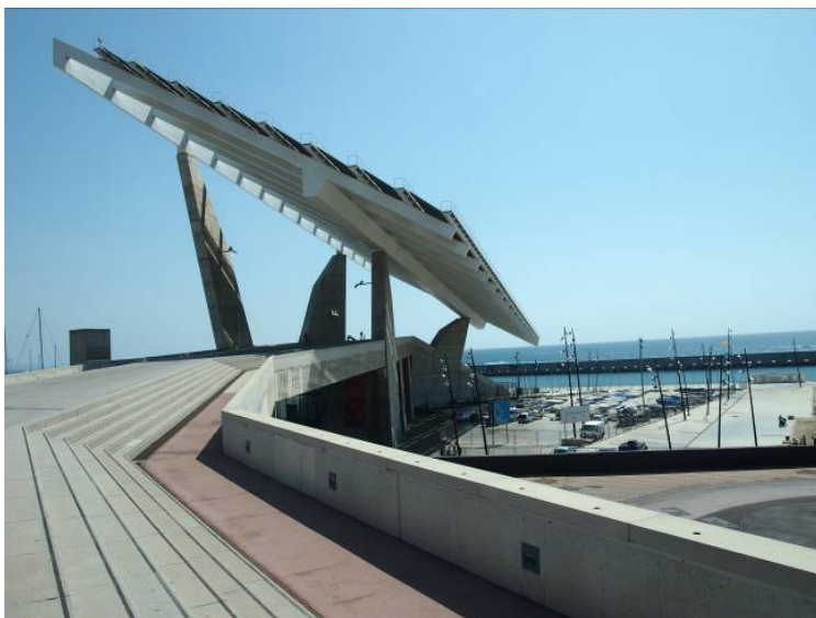
Ryc. 3 Barcelona, Forum 2004, Plac Forum z bateria ogniwo woltaicznych.

mogło sobie na to pozwolić, styk morza i lądu stawał się lokalizacją poszukiwaną, coraz bardziej cenną zarówno w kategoriach ekonomicznych jak i wizerunkowych. Toteż tam gdzie Carrer de la Marina dochodziła do morza przeciągnięto do niego uliczną siatkę Cerdy, minimalnie ją odkształcając, po to chyba, aby podkreślić postmodernistycznego ducha epoki.