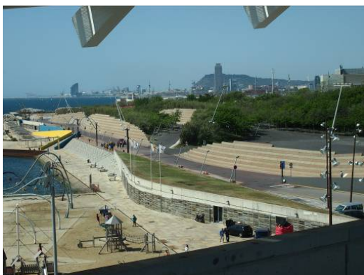
Ryc. 4 Barcelona, Forum 2004, Plac Forum, widok z placu w kierunku zachodnim, na miasto. W głębi wzgórze Montjuïc