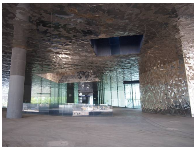
Ryc. 2 Barcelona, Forum 2004, Muzeum Historii Naturalnej, Jacques Herzog i Pierre de Meuron. Fig. 2. Barcelona, Forum 2004, Museum of Natural History, Jacques Herzog and Pierre de Meuron.

W takich okolicznościach rozpisano konkurs na zaplanowanie nowych dzielnic miasta na odzyskanych terenach. W rezultacie postanowiono zrealizować konkursową koncepcję Ildefonsa Cerdy. Oparta jest na kwadratowej siatce osi ulicznych o boku 113,3 m., na które nałożone są ulic o podstawowej szerokości 20 m. Siatka wypełniała całą wolną przestrzeń między starym miastem a wzgórzami na północy. Przecięta jest wielkimi arteriami, diagonalami, które umożliwiały wprowadzenie publicznego transportu. Taki był plan, rozpoczęła się gra o jego realizację, którą Cerda prowadził pod hasłem „urbanizować wieś, ruralizować miasto”, co można uznać za początek tego, co dziś nazywamy zrównoważonym rozwojem.