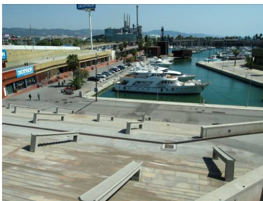
Ryc. 5 Barcelona, Forum 2004, Plac Forum, widok z placu w kierunku wschodnim, na port jachtowy i elektrownię.