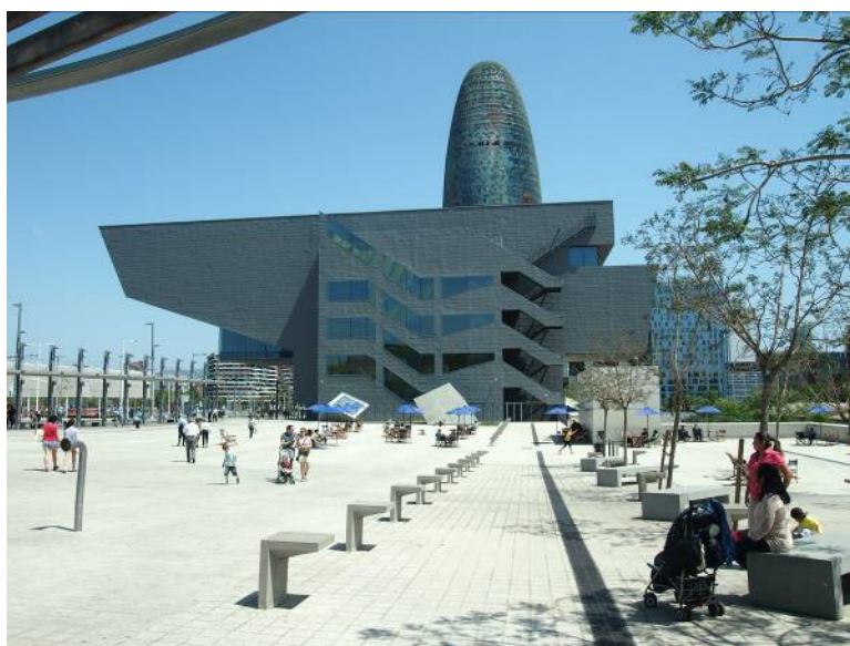
Ryc. 8. Barcelona, Placa de les Glories Catalones, Muzeum Designu (MBM), z tyłu Torre Agbar (J.Nouvel).

Fig. 7. Barcelona, Placa de les Glories Catalones, Torre Agbar (J. Nouvel) and Museum of Design (MBM) from roofed market.