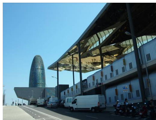
Ryc. 7. Barcelona, Placa de les Glories Catalones, Torre Agbar (J.Nouvel) i Muzeum Designu (MBM) od zadaszonego targu.

Fig. 6. Barcelona, Placa de les Glories Catalones, roofed market, author: b720 Fermin Vazquez. Behind the square there is theater P. Boffil with R. Moneo auditorium.