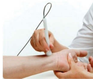
Rys. 2 Aparat SphygmoCor

tętna na tętnicy promieniowej, dokonywanej w sposób inwazyjny, przy określonych cechach osobowych, np. płci, wieku, masie ciała, wzroście [7-9]. Otrzymany wynik pozwala na określenie ciśnienia centralnego, będącego czulszym wykładnikiem ryzyka sercowo-naczyniowego niż ciśnienie obwodowe [9, 11].