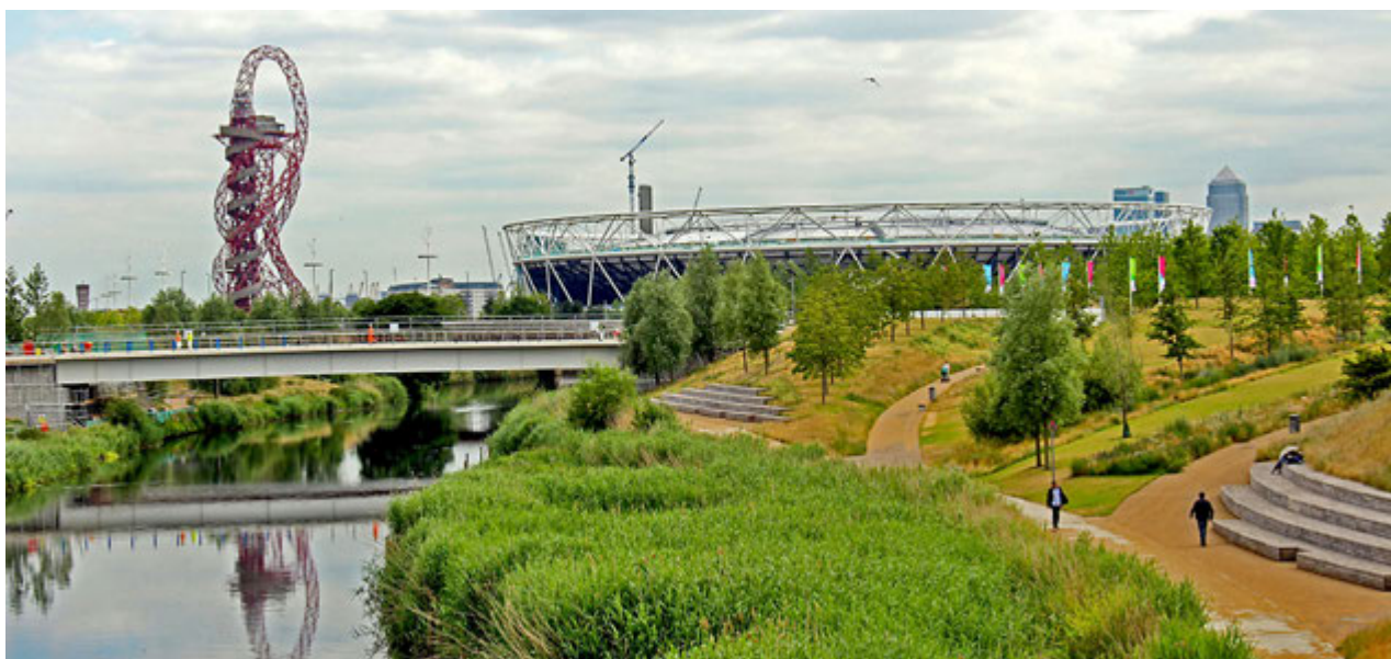
3. Queen Elisabeth Olympic Park.

240 mln funtów). Podkreślano, że utrzymanie będzie kosztowało milion funtów rocznie. Konstrukcja dachu przez swoją ekstrawagancką formę waży cztery razy tyle, co podobnej wielkości dach budowany nad olimpijskim welodromem, a budynek basenu emituje trzy razy więcej dwutlenku węgla do