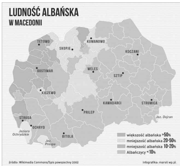
Rysunek 4. Ludność albańska w Macedonii

Republika Macedonii borykała się dodatkowo z problemami natury społecznej, z którymi nie była w stanie sobie skutecznie radzić. Rozwarstwienie społeczeństwa na mniejszość muzułmańską i chrześcijańską dodatkowo pogłębiało kryzys. „Ludność albańska zaczęła podkreślać swą odrębność przez manifestacje przynależności do kręgu islamu (...), islam był identyfikowany z Albańczykami, a prawosławie z Macedończykami” 15 . Kraj stał się podatny na wpływy z zewnątrz tak bardzo, że konflikty wewnętrzne były często rozwiązywane w oparciu o przekonania demokratyczne takich państw, jak Stany Zjednoczone Ameryki czy też organizacje międzynarodowe.