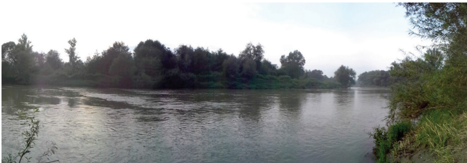
Rysunek 3. Rzeka Ropa (autor: Magdalena Jarosz)