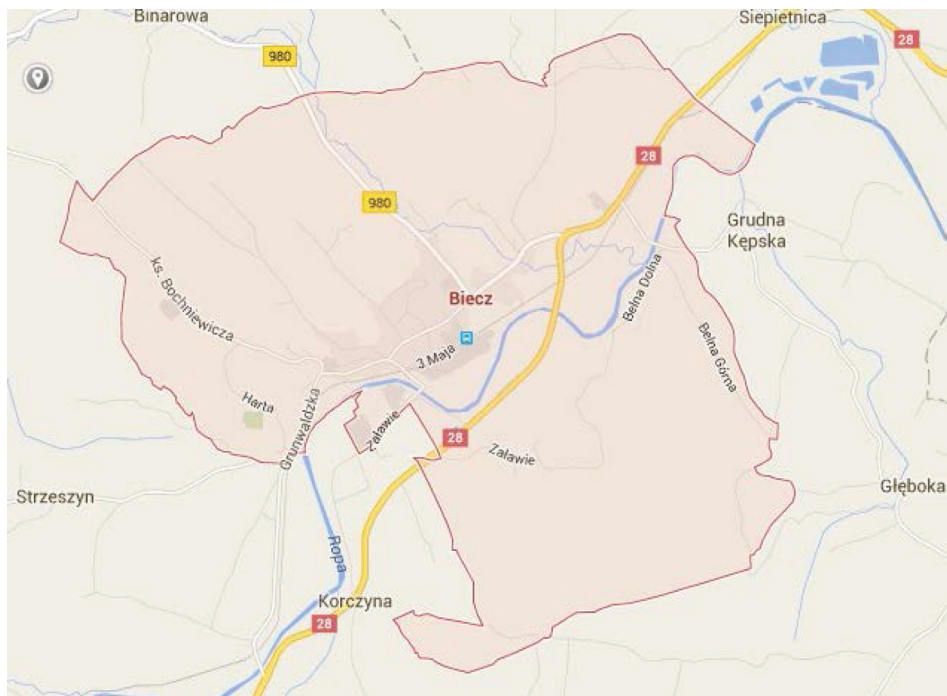
Rysunek 1. Rzeka Ropa na tle miasta Biecz (mapa google)

Badaniami objęto 63 działki ewidencyjne, w zakresie których nastąpiła regulacja granic. Analizowane działki pogrupowano w czterech przedziałach klasowych o obszarach 0-0,20 ha, 0,21-0,50 ha, 0,51-1ha, powyżej 1ha. Najliczniejszą grupę stanowią najmniejsze działki o powierzchni nie przekraczającej 20 arów (26 działek). Dwa kolejne przedziały wielkości zawierają zbliżoną do siebie liczebność 16 i 17 działek. W ostatnim przedziale o powierzchni powyżej 1 ha, odnotowano najmniej, bo jedynie 4 działki. Ustalanie linii brzegu spowodowało, że łączna powierzchnia gruntów dla wydzielonych działek znajdujących się pod wodami, wyniosła około 14,5 ha. Pozostała powierzchnia o dotychczasowym przeznaczeniu zmniejszyła się z 34 ha do około 19,5 ha. Skala zmian dla obszaru zajętego przez wodę w stosunku do pierwotnego sięga aż 42% wyjściowej powierzchni. Sytuacja ta dobrze, obrazuje w jakim zakresie wody płynące mogą zmieniać swój zasięg, powodując utrudnienia w korzystaniu z przyległych gruntów.