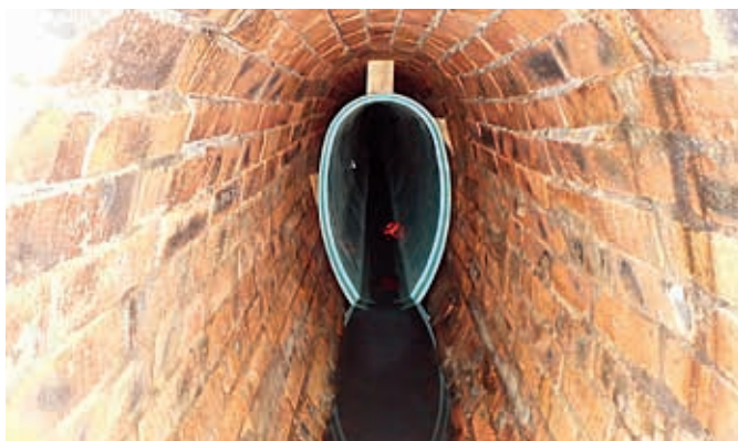
Kanał ceglany w trakcie naprawy