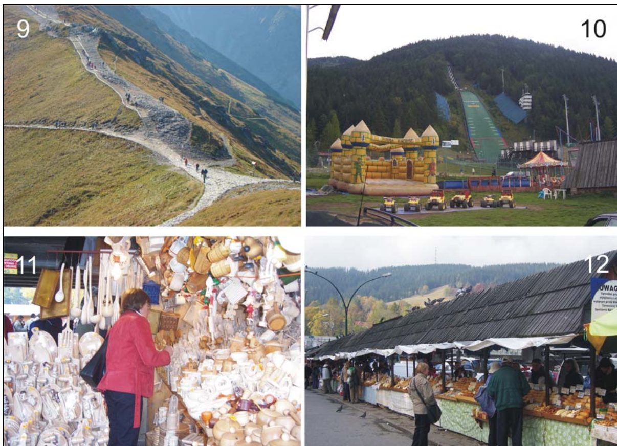
Fot. 9. Ruch turystyczny na grani Kasprowego Wiechu.

Photo 9. Tourist traffic on the ridge of Kasprowy Wierch.