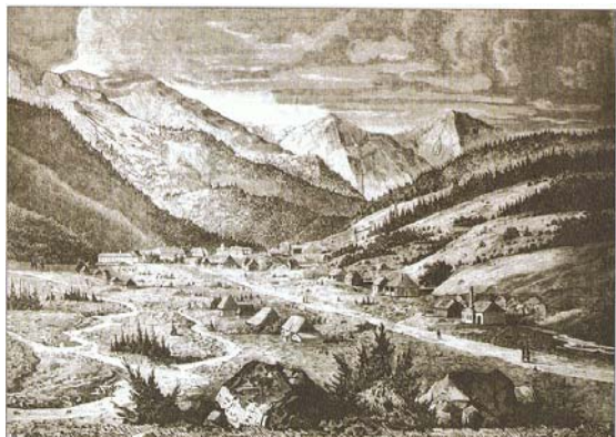
Fot. 1. Kuźnice w końcu XIX w (fot. Pisera, 2007).

Liczba przyjezdnych stopniowo wzrastała. W 1860 r. do Zakopanego przyjechało zaledwie 59 osób i liczba ta podwoiła się dopiero w ciągu dziesięciu lat. Jednak od 1886 r. zanotowano gwałtowny wzrost liczby turystów, który związany był upowszechnieniem funkcji uzdrowiskowej (m.in. powstaniem Stacji Klimatycznej). W 1900 r. w samym Zakopanem przebywało już 8000 przyjezdnych (Pisera, 2007).