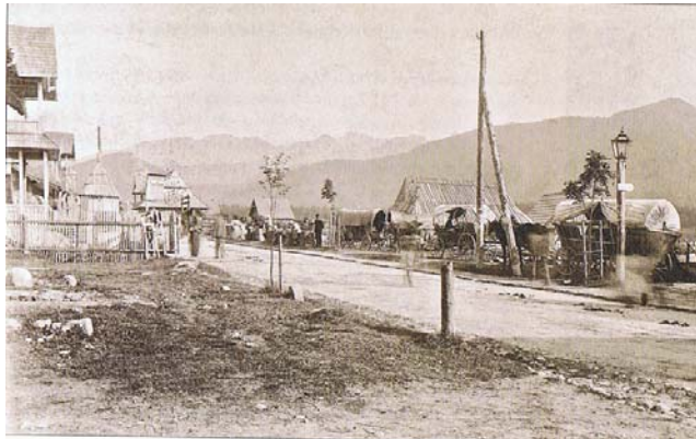
Fot. 2. Krupówki w końcu XIX w..

Photo 1. Kuźnice on the end of 19 century.