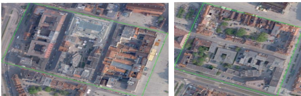
Rys. 2. Fragmenty ortofotomap przedstawiające obszary testowe – Wrocław, Stare Miasto

Dane te były pozyskane w 2006 r na zamówienie Urzędu Miasta Wrocław i zostały udostępnione dla realizacji projektu przez firmę Tele Atlas oraz francuską firmę FiC Conseil. Dla potrzeb projektu wytypowano 2 obszary ze Starego Miasta, charakteryzujące się bardzo gęstą zabudową, o złożonych bryłach budynków ze skomplikowanymi kształtami dachów. Na jednym z nich występuje dodatkowo zieleń miejska (rys. 2). Powyższe dane stanowią idealny zestaw danych źródłowych dla realizacji celu projektu.