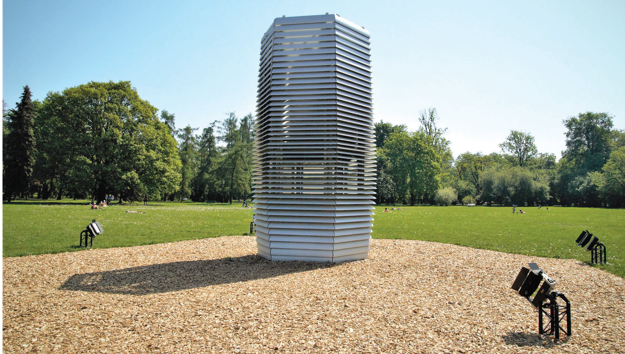
Il. 1. Wieża antysmogowa stojąca w Parku Jordana w Krakowie, Foto. Autor Ill. 1. The anti-smog tower standing in Park Jordana, Krakow, original photograph

redukuje stężenie pyłów PM10 o 12% w promieniu 10 m od oczyszczacza, natomiast w promieniu 50m jej wpływ jest już niedostrzegalny 10 . Również testy prowadzone w Chinach nie potwierdziły deklarowanej przez projektanta możliwości filtrowania przez urządzenie do 30 tysięcy m 3 powietrza na godzinę. Dużo większe nadzieje można wiązać z powstającą w Chinach eksperymentalną wieżą antysmogową o wysokości ponad 100 m. Przez swoich twórców określana jest jako model, mający sprawdzić zaproponowane rozwiązania przed wybudowaniem docelowego filtra powietrza o wysokości 500 m. Faza testów pokazała, że wybudowana w mieście Xian wieża jest w stanie zredukować o 15% stężenie pyłów na obszarze o powierzchni 10 km 2 . Według projektantów pełnowymiarowa wieża ma móc oczyścić powietrze w średniej wielkości mieście. Zasada działania opiera się na naturalnej cyrkulacji powietrza, które zasysane jest do ogrodu u podstawy wieży, przykrytego ogniwami fotowoltaicznymi. Następnie za pomocą energii uzyskanej z ogniw jest ono podgrzewane i kierowane do wnętrza wieży, w której zamontowane są filtry. Po przejściu tego procesu powietrze wyrzucane jest z powrotem na zewnątrz. Pomysłodawcy tego rozwiązanie przygotowali również wersję urządzenia do stosowania w centrach wielkich aglomeracji, gdzie techniczna strona urządzenia schowana jest pod wielkimi ekranami LED, na których można wyświetlać reklamy, co ma zredukować koszty użytkowania tego typu rozwiązania w mieście.