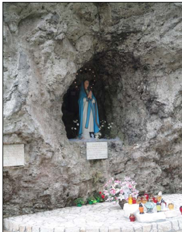
Fot. 5. Figura MB w skalnej wnęce w Ojcowie – Zazamczu). Photo 5. Figure of Mother of God in rocky niche in Ojcow – Zazamcze.