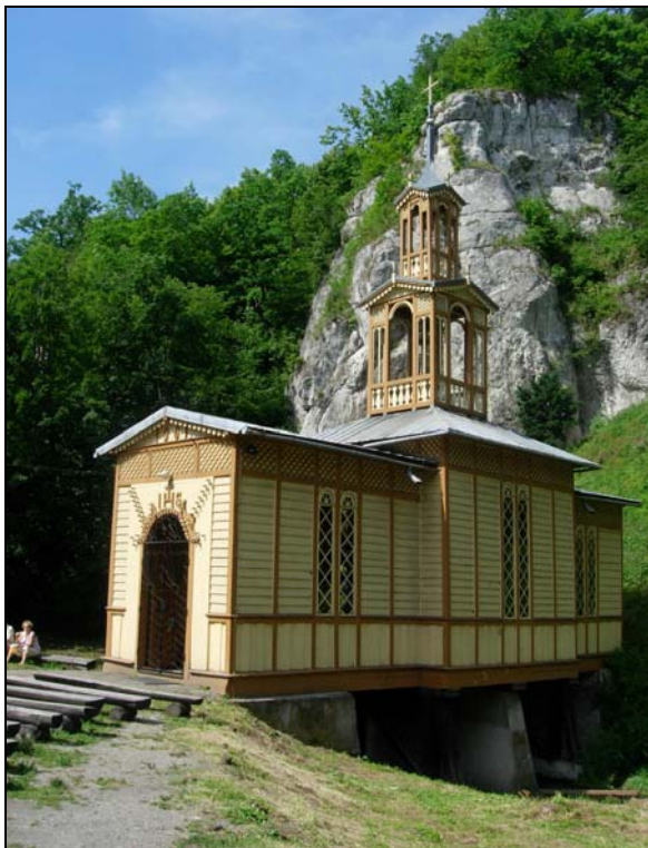
Fot. 2. Kościół parafialny p.w. św. Józefa Robotnika w Ojcowie znany jako kaplica umieszczona na drzewie „Na Wodzie”. Photo 2. St. Joseph the Worker Parish church in Ojcow known as the chapel „On the water.”