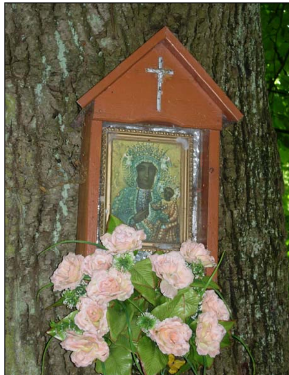
Fot. 3. Kapliczka skrzynkowa w Ojcowie. Photo 3. Wayside cabinet shrine located on a tree.