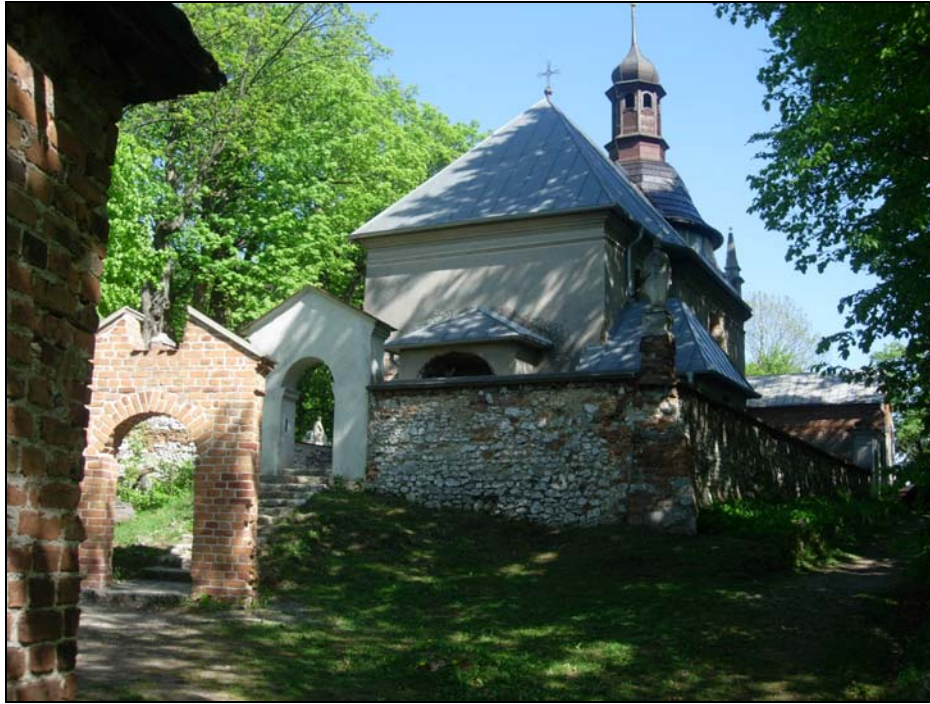
Fot. 1. Zespół sakralny w Grodzisku. Photo 1. Sacred complex in Grodzisko.