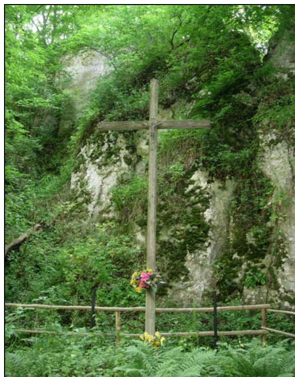
Fot. 7. Krzyż u stóp ruin zamku ojcowskiego. Photo 7. Cross at the foot of ruins of Ojcow Castle.