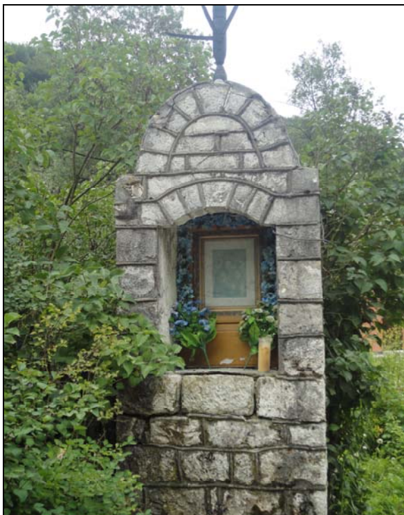
Fot. 4. Kapliczka murowana w Ojcowie. Photo 4. Brick shrine in Ojcow.