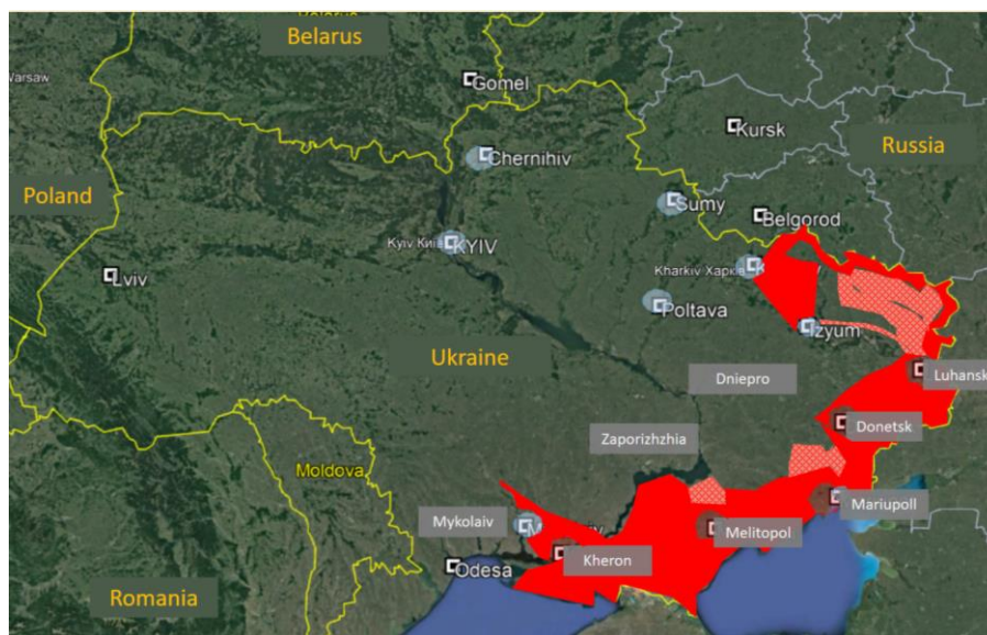
Rys. 3 Główne kierunki działań zaczepnych rosyjskiej inwazji na Ukrainę. Stan - maj 2022 r.