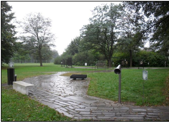
Fot. 3. Ogród Doświadczeń, Krakowie. Photo 3. Garden of Experiences, Krakow.