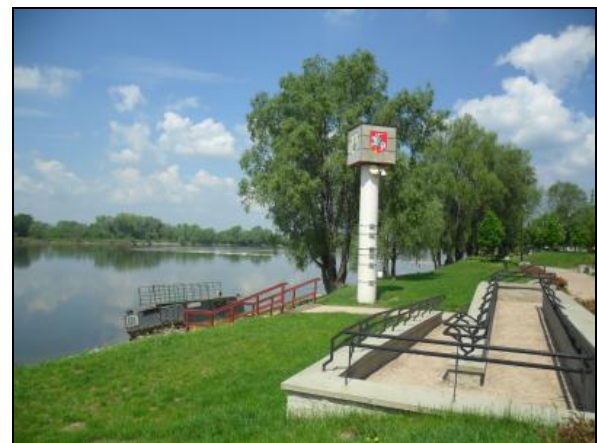
Fot. 6. Bulwary Wiślane, Puławy. Photo 6. Embankments of the Vistula River, Puławy.