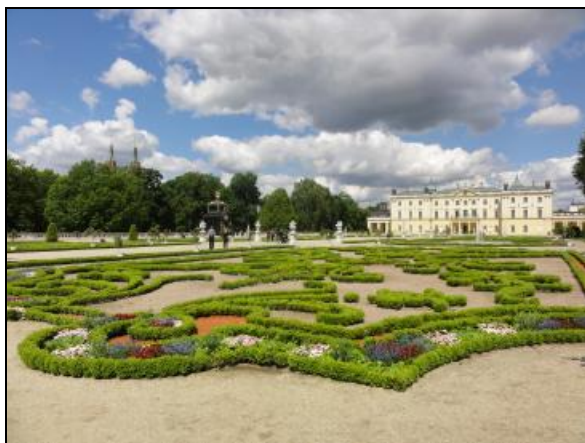
Fot. 5. Ogród Branickich, Białystok. Photo 5. Garden of Branicki Family, Białystok.