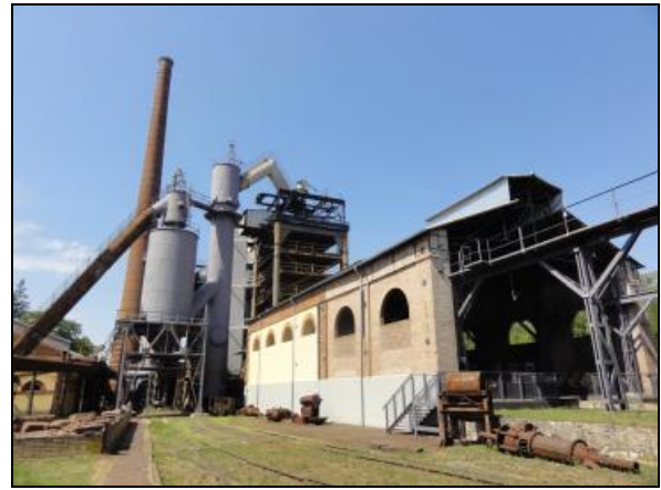
Fot. 2. Huta Żelaza, Starachowice. Photo 2. Ironworks, Starachowice.