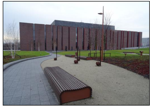
Fot. 4. Ogród NOSPR, Katowice. Photo 4. NOSPR Garden, Katowice.