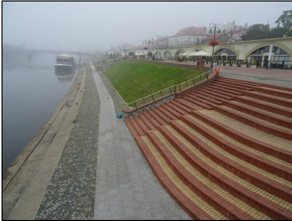
Fot. 1. Bulwar Nadwarciański, Gorzów Wielkopolski. Photo 1. Embankment of the Warta River, Gorzów Wielkopolski.