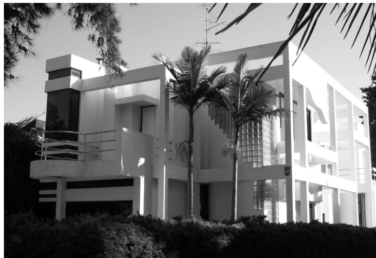
Ryc. 9. „Biała willa” nad Morzem Śródziemnym – Herzliya