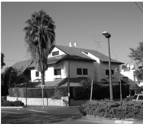
Ryc. 8. Dom mieszkalny – Herzliya; fot. D. Agranowicz, 2009