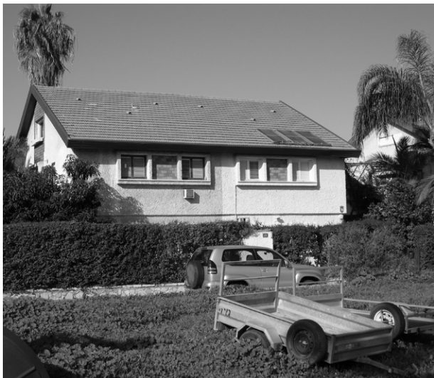
Ryc. 6. Dom mieszkalny – Herzliya; fot. D. Agranowicz, 2009