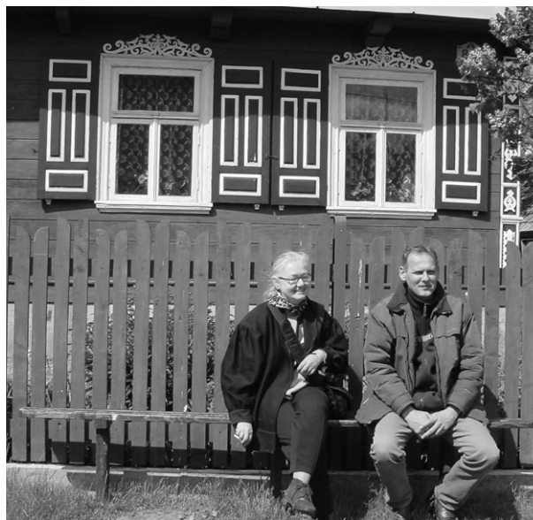
Ryc. 11. Podlasie Wschodnie – projekt „Kraina Otwartych Okiennic”; fot. autorka, 2004