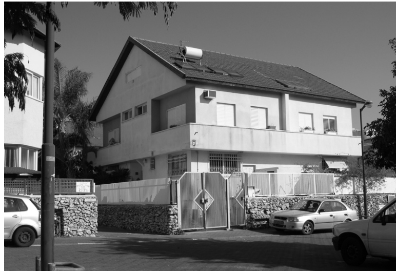
Ryc. 5. Dom mieszkalny – Herzliya; fot. D. Agranowicz, 2009