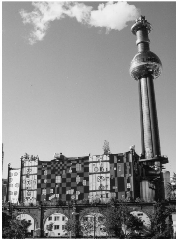
Ryc. 1. Modernizacja ciepłowni miejskiej ze spalarnią odpadów, Wiedeń-Spittelau; fot. autorka, 1997

Pierwsze trzy skóry są fizyczne, zatem dość łatwo je opisać, bowiem opis dotyczy rzeczywistości postrzeganej przez człowieka/obserwatora. Z czwartą skórą już tak prosto nie jest. Jednak, per analogiam , wyczuwając, że opis skór odbywa się od szczegółu do ogółu, można zauważyć, że na tożsamość człowieka składają się zarówno nasze trzy pierwsze skóry (naturalna, ubranie, dom), jak i coś więcej, co może trudniej opisać, a łatwiej wyczuć. Bo tożsamość to także pewna metafizyka egzystencji ludzkiej.