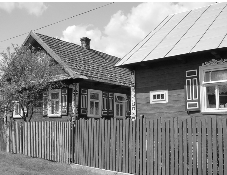
Ryc. 10. Podlasie Wschodnie – projekt „Kraina Otwartych Okiennic”