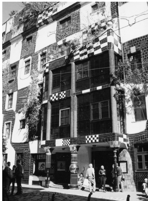
Ryc. 2. Kunsthaus Wien; fot. autorka, 1997