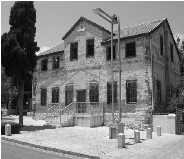
Ryc. 4. Dom mieszkalny – Herzliya