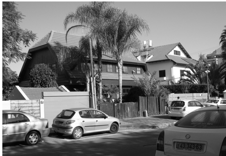
Ryc. 7. Dom mieszkalny – Herzliya; fot. D. Agranowicz, 2009