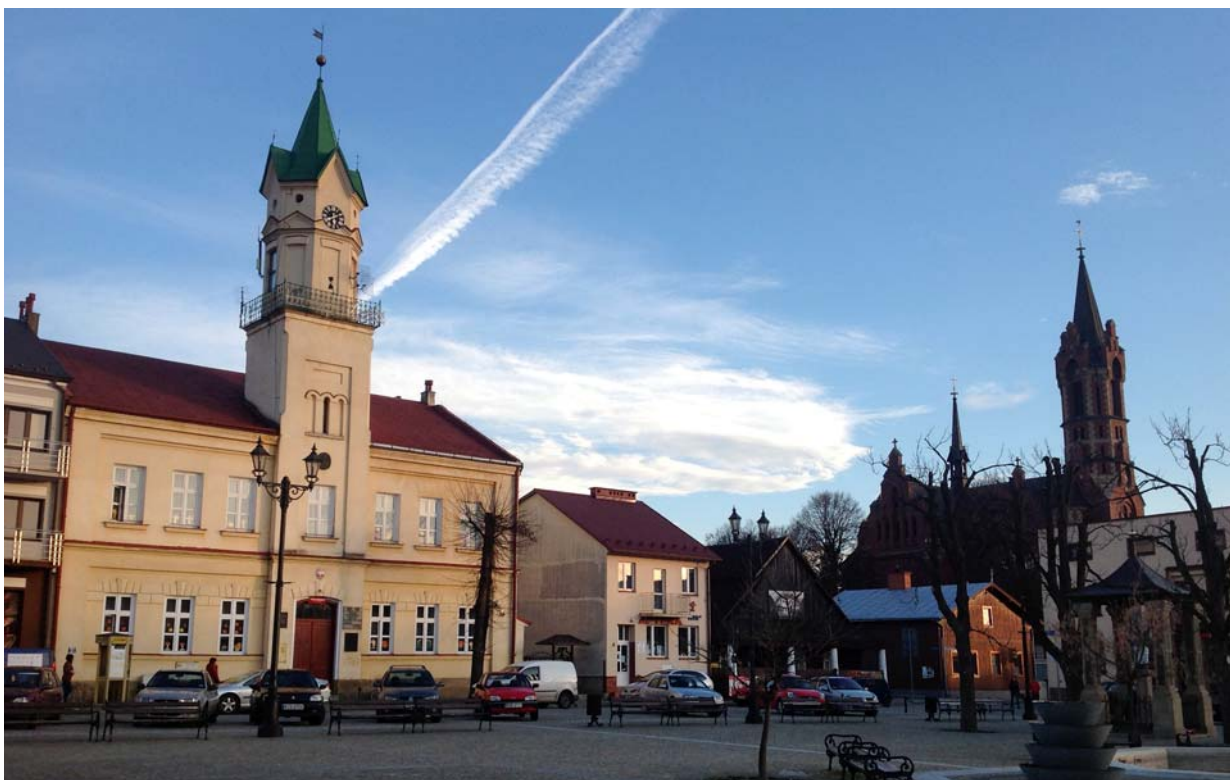
Ryc. 5. Rynek w Kolaczycach obecnie. Widok od północnego-zachodu, 11.2013 Fig. 5. Market square in Kolaczyce nowadays. View from the north-west, 11.2013