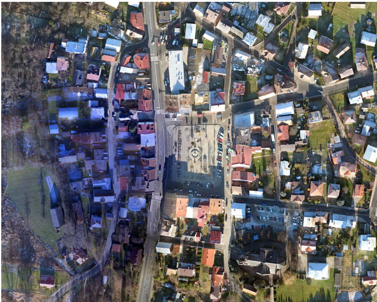
Ryc. 3. Kolaczyce obecnie. Widok na zdjęciu lotniczym, 12.2013, fot. W. Gorgolewski Fig. 3. Kolaczyce nowadays. An aerial photo view, 12.2013, photo: W. Gorgolewski