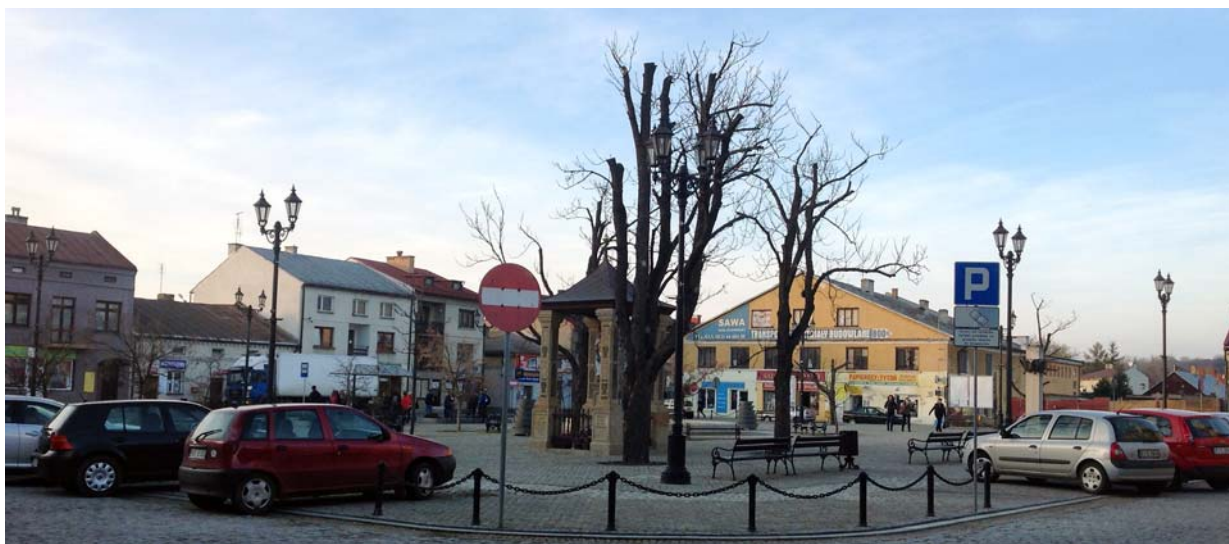
Ryc. 4. Rynek w Kołaczycach obecnie. Widok od południowego-wschodu, 11.2013, fot. D. Kuśnierz-Krupa Fig. 4. Market square in Kołaczycach nowadays. View from the south-east, 11.2013, photo: D. Kuśnierz-Krupa

zapewne kaplica oznaczona na mapie Miega takim samym umownym symbolem jak kościół parafialny.