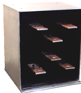
Rys. 1. Trójfazowy transformator przetwornicy elektromobilnej dla stref zabrudzenia PD4.

Oddziaływania mechaniczne są niezwykle ważnym aspektem w zastosowaniach elektromobilnych. Metody badań odporności transformatorów na drgania powstające w trakcie ruchu pojazdu i przenoszone na urządzenia zainstalowane na pokładzie definiuje norma PN-EN 61373. Dokument precyzuje częstotliwości i amplitudy drgań działających w różnych płaszczyznach na transformator w zależności od miejsca zainstalowania urządzenia na pojeździe szynowym.