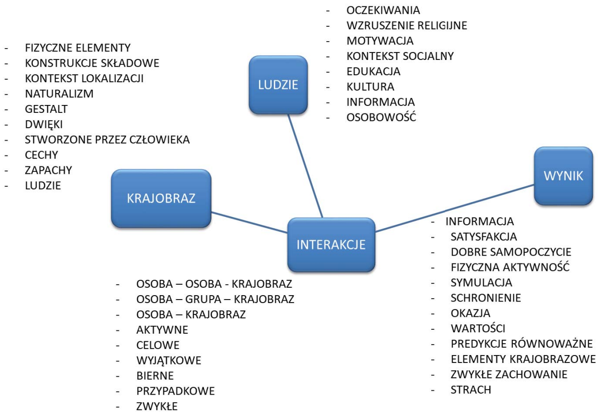
Il. 2. Model percepcji krajobrazu wg Zube.