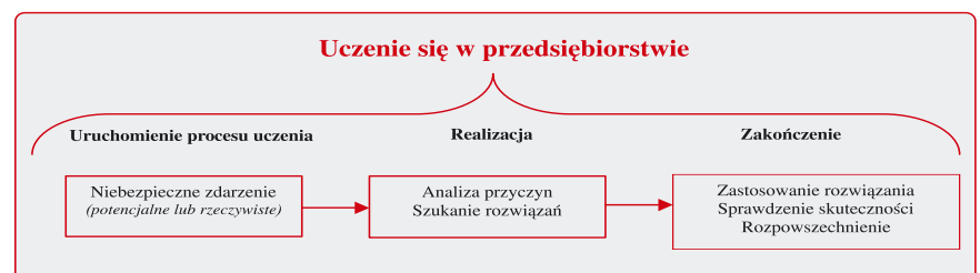
Rys. 1. Uczenie się w przedsiębiorstwie

Czynniki bezpośrednio wywołujące proces uczenia się w przedsiębiorstwie wynikają bądź z jego specyfiki (pojawiające się problemy związane z bezpieczeństwem pracy, produkcją czy finansami), bądź ze zmian zachodzących w jego otoczeniu (właściwości środowiska naturalnego, nowe uwarunkowania prawne, aktualne wymagania rynku). Jak wynika z cytowanych definicji, nieodłącznym elementem uczenia się w przedsiębiorstwie jest rozwój oraz związane z nim zmiany.