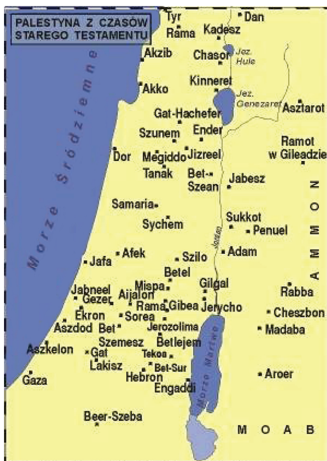
Rys. 1. Mapa Palestyny z czasów Starego Testamentu

W starożytności obecna Palestyna nosiła nazwę Kanaan. Ze względu na położenie geograficzne oraz znaczenie religijne była podbijana przez wiele ludów. Około 3200 r. p.n.e. została zasiedlona przez Kananejczyków. W XII wieku p.n.e. na terenach południowego wybrzeża Kanaanu zamieszkali Filistyni. Pod koniec XI wieku p.n.e. powstało na tym terytorium państwo żydowskie. W 1370 r. p.n.e. została podbita przez Hetytów, a około 587 r. p.n.e. przez Babilonię. W 538 r. p.n.e. weszła w skład imperium perskiego, a w 332 r. p.n.e. podbił ją Aleksander Macedoński. Następnie znalazła się pod panowaniem dynastii Ptolemeuszów, a później dynastii Seleucydów. Od 395 r. Palestyna stała się częścią cesarstwa wschodniorzymskiego, a w latach 634-640 została podbita przez Arabów.