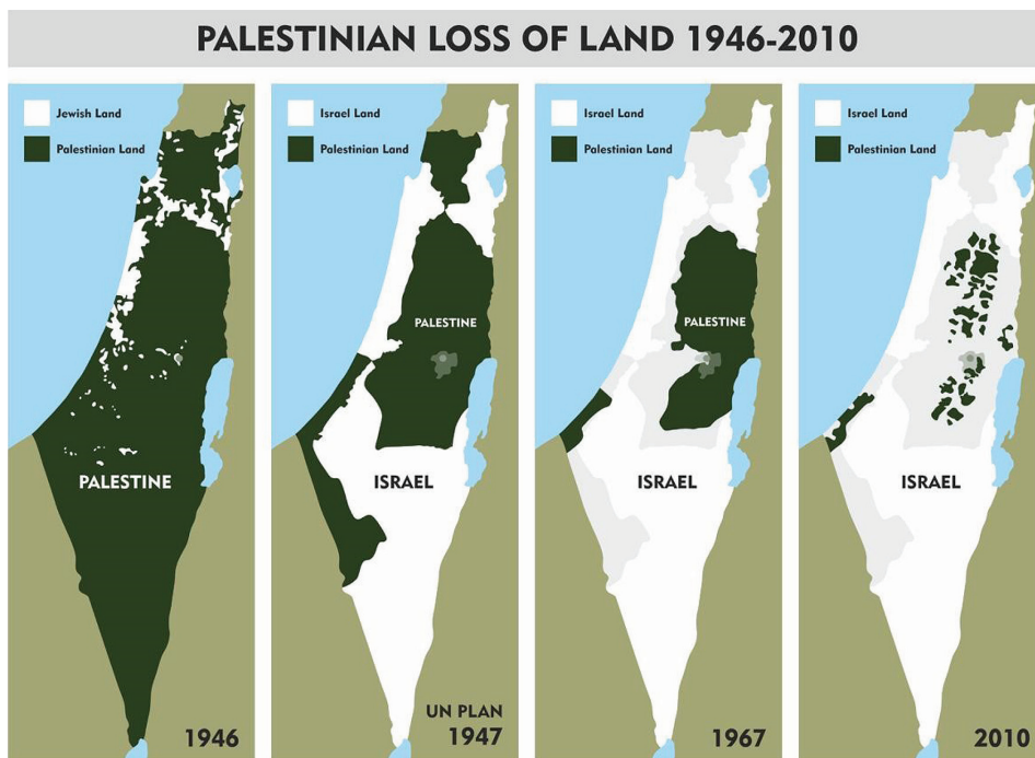
Rys. 4. Mapa Palestyny 1946-2010