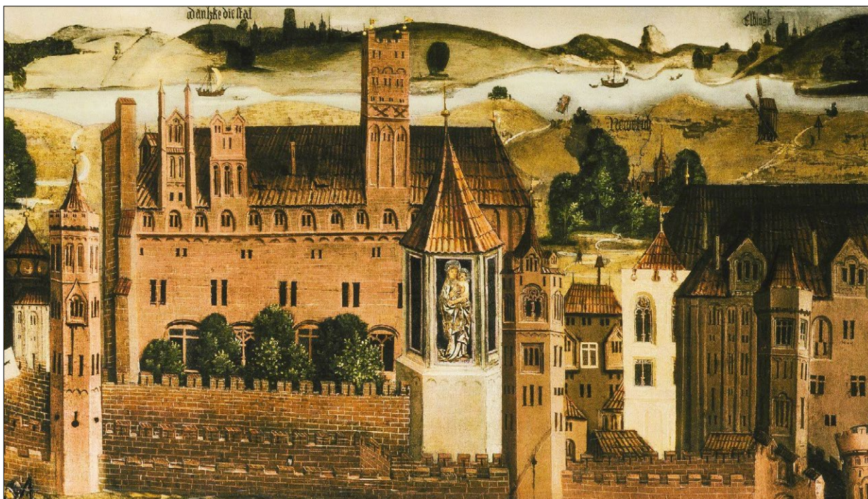
Ryc. 2. Najstarszy widok zamku od wschodu – zaginiony w 1945 obraz z gdańskiego Dworu Artusa Oblężenie Malborka z 1460, fragment z Zamkiem Wysokim i kościołem NMP.