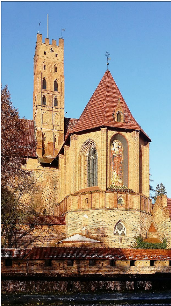
Ryc. 6. Presbiterium kościoła zamkowego NMP z ukończoną rekonstrukcją figury Madonny; fot. K. Kołodziejczyk.

Fig. 6. Presbytery of the castle's Blessed Virgin Mary Church with a finished reconstruction of the Madonna statue; photo by K. Kołodziejczyk.