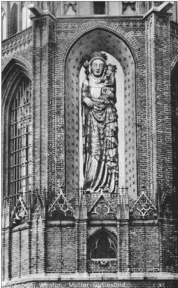
Ryc. 3. Fotografia wschodniej ściany prezbiterium kościoła zamkowego NMP z figurą Madonny, stan z początku XX wieku.