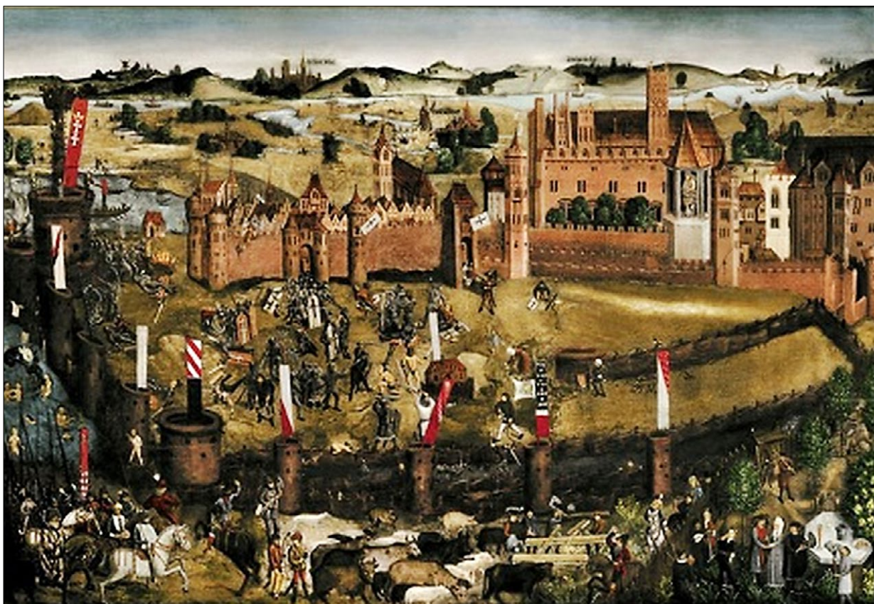
Ryc. 1. Najstarszy widok zamku od wschodu – zaginiony w 1945 obraz z gdańskiego Dworu Artusa Oblężenie Malborka z 1460 .