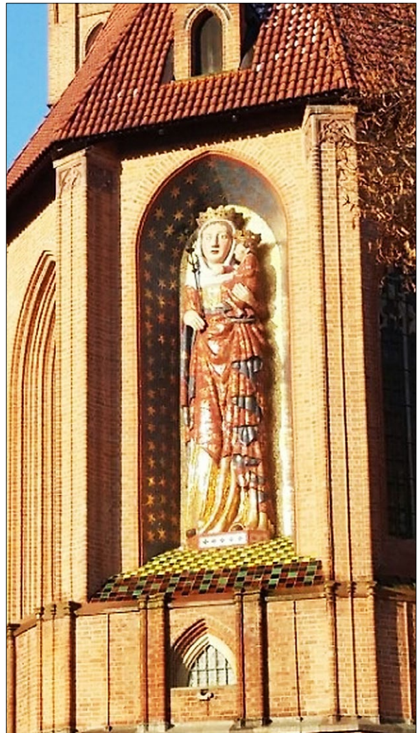
Ryc. 7. Figura Madonny w niszy okiennej presbiterium kościoła zamkowego NMP w promieniach wschodzącego słońca; fot. K. Kołodziejczyk.

Można zatem postawić pytanie, na ile nowa powłoka mozaikowa była zabiegiem spowodowanym potrzebą