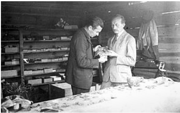
Ryc. 3. Józef Kostrzewski i Zdzisław Rajewski w osadzie w Biskupinie

Fig. 2. North-east fragment of the settlement in Biskupin, visible constructions of dwellings