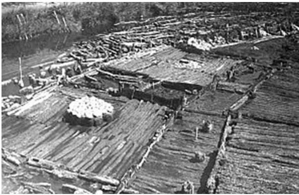
Ryc. 2. Północno-wschodni fragment osady w Biskupinie, widoczne konstrukcje chat

Fig. 2. North-east fragment of the settlement in Biskupin, visible constructions of dwellings