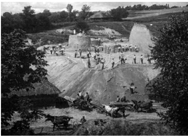
Ryc. 6. Gródek (Horodok), badania paleolityczne L. Sawickiego na stanowisku II ze zbiorów PMA, źródło: D. Piotrowska, Z działalności instytucji II Rzeczypospolitej chroniących zabytki archeologiczne na zachodniej Ukrainie , Przegląd Archeologiczny , vol. 54, 2006, s. 61–98

Fig. 6. Gródek (Horodok) – palaeolithic research by L. Sawicki on site II from the PMA collection, source: D. Piotrowska, From the work of institutions in II Republic on protecting archaeological monuments in western Ukraine , Przegląd Archeologiczny , vol. 54, 2006, p.61–98