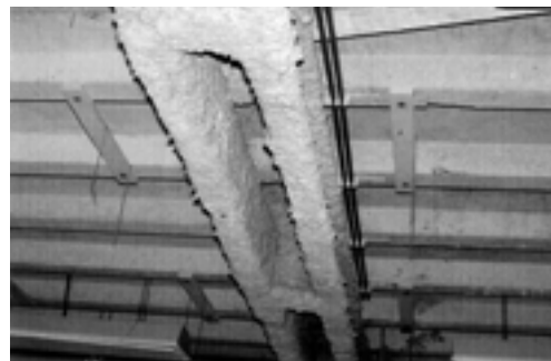
Zabezpieczenie przeciwpożarowe – azbest natryskiwany na konstrukcje stalowe.

[1] Obmiński A. Identyfikacja azbestu w materiałach budowlanych. Zasady postępowania z materiałami budowlanymi zawierającymi