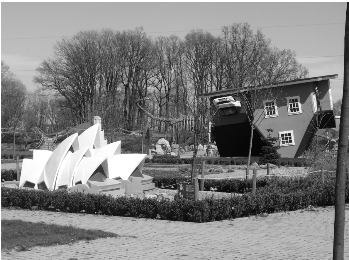
Rycina 1. Homogenizacja parku tematycznego – park miniatur, dom do góry nogami i park dinozaurów

turze (Kruczek, 2009, s. 74-75). Jako przykłady takich obiektów podaje m. in. tematyczne parki rozrywki (Ryc. 1).