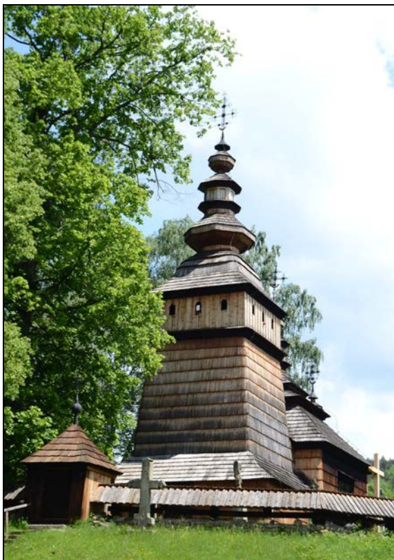
Fot. 1. Cerkiew w Kotani. Photo 1. Orthodox church in Kotań.