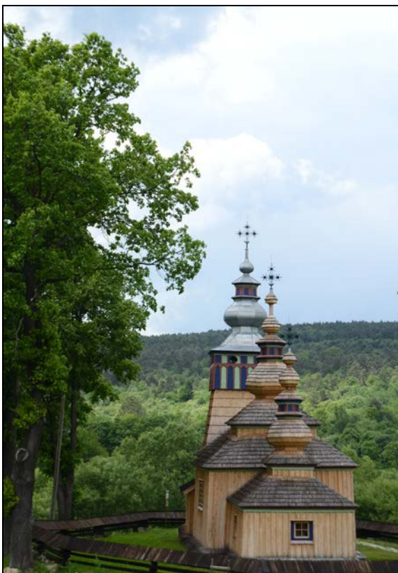
Fot. 3. Cerkiew w Świątkowej Małej. Photo 3. Orthodox church in Świątkowa Mała.