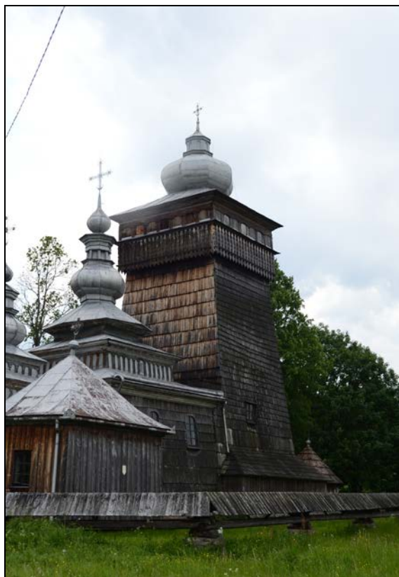
Fot. 4. Cerkiew w Świątkowej Wielkiej Photo 4. Orthodox church in Świątkowa Wielka.