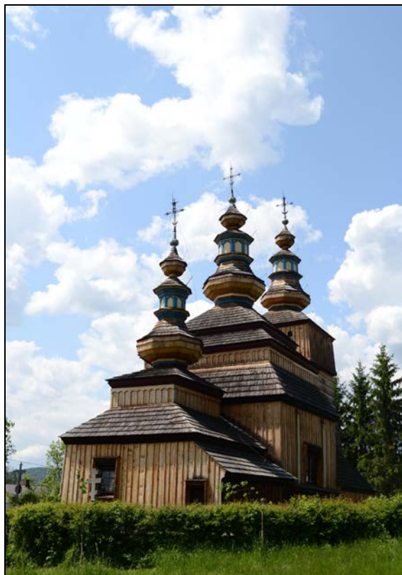
Fot. 2. Cerkiew w Krempnej. Photo 2. Orthodox church in Krempna.