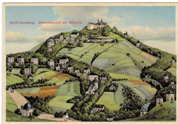
II. 1. Góra Świętej Anny, pocztówka litograficzna z 2. poł. XIX w.