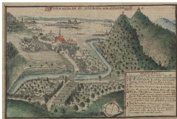
Il. 3. Bardo na rys. F.B. Wenera w poł. XVIII w. Za: F.B. Werner, Topographia seu Compendium Silesiae. Pars II. [...], (Biblioteka Uniwersytecka we Wrocławiu Oddział Rękopisów, sygn.IVF113b wol.2, str. 567).

Wzgórze oplata gęsta sieć stromych dróg i ścieżek przecinających las. Prowadzą nimi trasy pątnicze, przy których stoją kapliczki oraz stacje dróg krzyżowych. Pierwsze z nich wzniesiono w latach 1714–1727, ale zbliżony do pierwotnego kształt za-