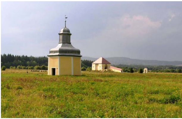
Il. 4. Kalwaria w Krzeszowie, Pałac Heroda (stacja XI), w głębi stacja XII – Dom Schodów i Pałac Piłata Fot. W. Brzezowski, 2014.