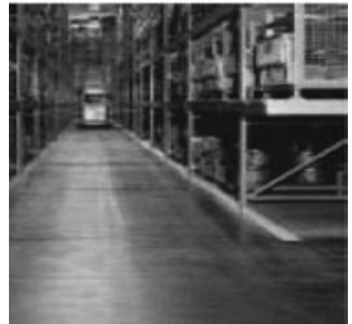
Rys. 2. Posadzka żywiczna uniwersalna, epoksydowa [8] Fig. 2. Epoxide floor [8]

W polskim systemie prawnym dopuszczalne warunki pracy są regulowane przez Kodeks pracy oraz rozporządzenia odpowiednich ministrów. W obszarze zagrożenia czynnikami chemicznymi w środowisku pracy istotnymi aktami prawnymi