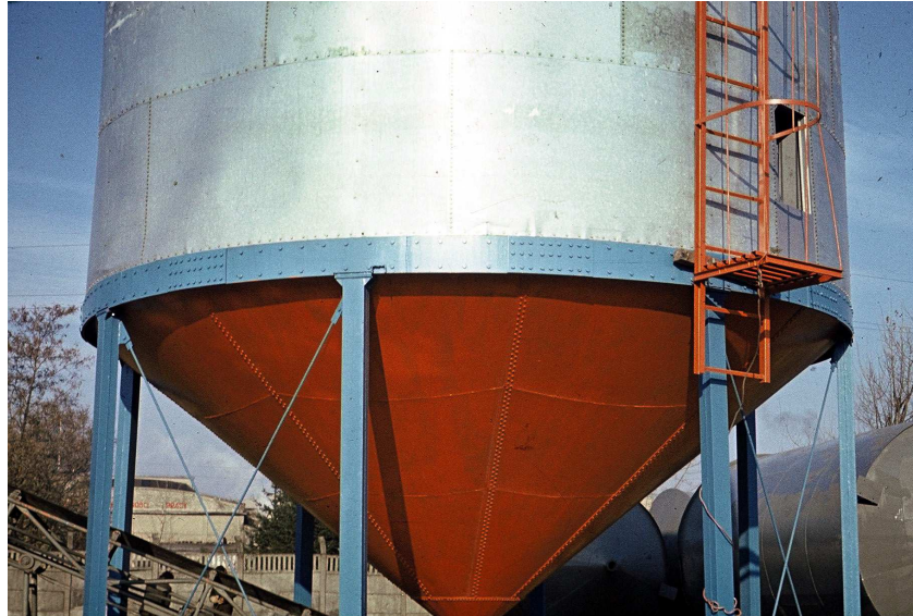
Rys. 3. Lej spustowy wraz z pierścieniem dolnym Fig. 3. Release funnel with a bottom ring