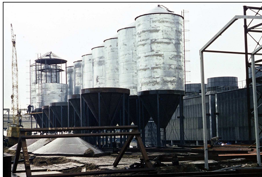
Rys. 4. Bateria zbiorników o pojemności V = 150 \text{ m}^3 Fig. 4. Silo battery of the volume V = 150 \text{ m}^3