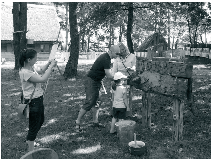
Fot. 5. Edukacja muzealna- pokaz dawnych technik budowlanych

Muzeum przygotowało również specjalną ofertę dla dzieci, które tego dnia mogą poukładać architektoniczne puzzle, drewniane klocki, ubrać papierową chałupę w detal oraz złożyć z papieru model kościoła. Cykliczne imprezy edukacyjne i lekcje muzealne zwrócone na tematykę ochrony drewnianej architektury cieszą się dużym powodzeniem. W 2015 roku w imprezy Tajemnice ciesiolki w ciągu jednego dnia brało udział 1008 osób.