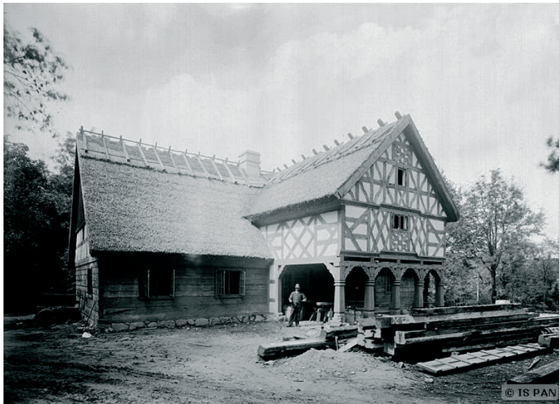
Fot. 1. Muzeum w Królewcu, budowa kopii chałupy z Burdajn, 1912 rok, IS PAN 0000113594

początku XX wieku: oberlandzko-warمیński, litewski i mazurski. Na planie Ostpreußisches Heimatmuseum z 1913 roku pokazano 26 obiektów 11 .