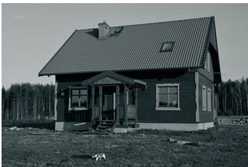
Fot. 6. Dom w Łutynowie, współczesne inspiracje

Budownictwo drewniane to eksponowane w Muzeum i to nadal zachowane w terenie inspiruje współczesnych projektantów do wznoszenia nowych budynków, w których odwołują się do tradycji.