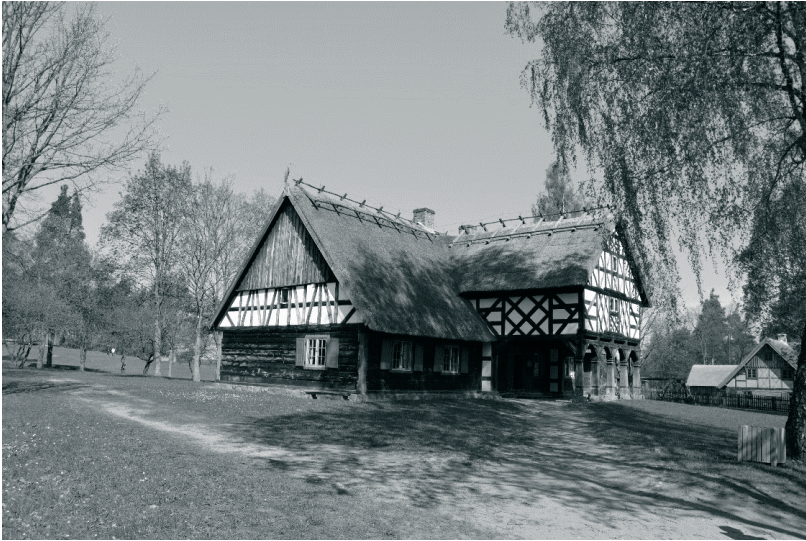
Fot. 2. Kopia chałupy ze wsi Burdajny w MBL-PE w Olsztynku, 2015 rok

szczytowych o polach wypełnionych cegłą i tynkowanych. Biel wypełnień malowniczo kontrastuje z ciemnym kolorem drewna, malowanymi okiennicami i szalunkowymi deskami na węglach. Wysunięta przed elewację frontową wystawka podcieniowa pełniła funkcję spichlerza. Oparto ją na ozdobnie opracowanych kolumnach zakończonych mieczami. W chałupie eksponowane jest wnętrze klasy szkolnej, w której odbywają się lekcje muzealne.