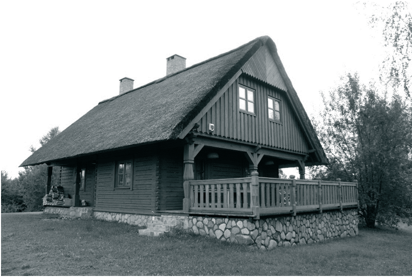
Fot. 7. Dom w Mycynach, współczesne inspiracje

Używanie tradycyjnego materiału jak kamienie polne w partiach cokołowych, drewno w konstrukcjach ścian, stosowanie konstrukcji ryglowych w gankach podcieniowych, zdobień z powtórzeniem detalu snycerskiego, dachówki w kolorze czerwonym, nadają nowym domom niepowtarzalny charakter, doskonale wpisując je w krajobraz historycznych wsi.