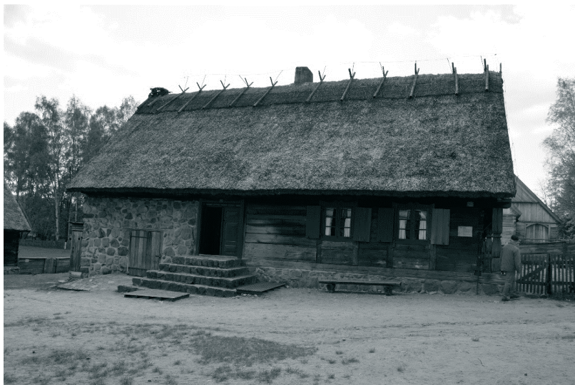
Fot. 3. Chałupa ze wsi Gązwa w MBL-PE w Olsztynku, 2015 rok

W wyposażeniu chałupy znajduje się piec kaflowy, najstarszy zachowany na Mazurach. Zabudowę zagrodową stanowią budynki przeniesione ze wsi Jerutki w gm. Świętajno, które w Muzeum nadal użytkowane są do hodowli ptactwa i zwierząt gospodarskich.