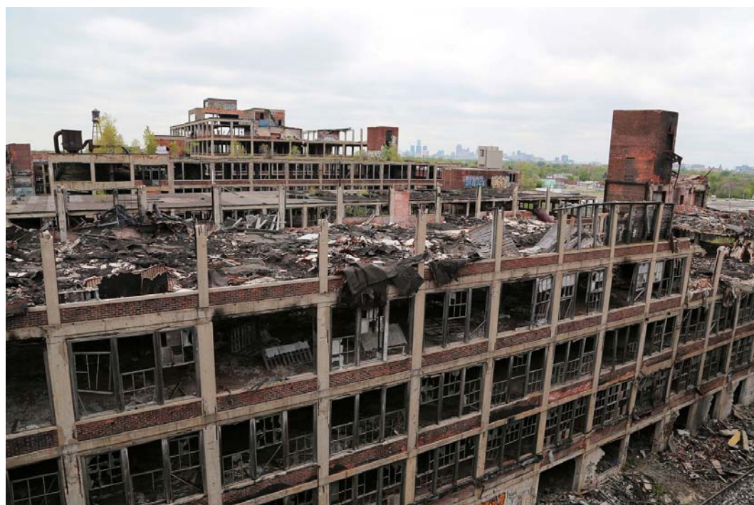
Fig. 2. The Packard Automotive Plant. Detroit. Ryc. 2. Samochodowy zakład Packarda. Detroit.

In this aspect of the problem, the concepts of regionalism, self-sufficiency, and national systems of voluntary environmental certification (“Green Standards”) take on extremely great importance in architecture. The aspects of energy efficiency, collection and utilization of rainwater, production, operation and utilization of building units, alternative sources of building materials, etc. are becoming of special importance as well.