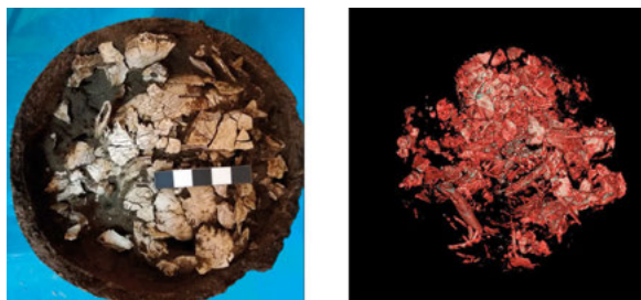
Rys. 3 Porównanie zdjęcia (po lewej) urny nr 50 wykonane podczas eksploracji oraz rekonstrukcji trójwymiarowej TK tego samego obszaru (po prawej)

a) Rekonstrukcja wolumetryczna urny, b) przekrój rekonstrukcji wolumetrycznej z kodowaniem barwnym obrazowanych gęstości, c) frakcja kostna o gęstości powyżej 1800 j.H. (dla lepszego obrazowania usunięto obraz urny), d) frakcja kostna (powyżej 1800 j.H.) oraz frakcja odpowiadająca szczątkom roślinnym (-1000 + -700 j.H.)