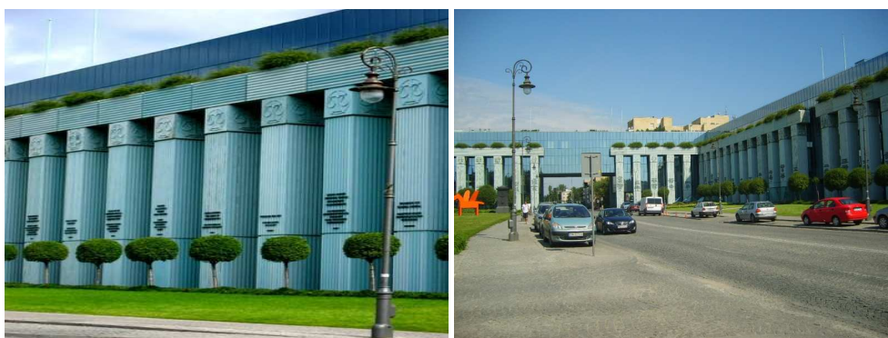
Rys. 2. Sąd Najwyższy w Warszawie