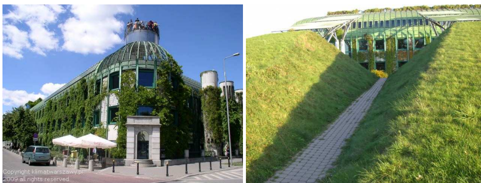
Rys. 1. Biblioteka Uniwersytetu Warszawskiego, fot. www.buw.uw.edu.pl/

oraz budynek Sądu Najwyższego. Biblioteka usytuowana nad Wisłą w pobliżu Zamku Królewskiego jest budynkiem zielonym pod każdym względem. Elementy zielone przemieniają się w architektoniczne motywy, a fasada sprawia wrażenie jakby wyrastała z ziemi. Materiałem budowlanym zastosowanym w dużej ilości jest szkło, które nadaje budynkowi wrażenie otwartości i przenikania się granic pomiędzy tym, co sztuczne, a tym, co naturalne. Jego ściany pokrywa roślinność. Najciekawszą częścią budynku jest ogród, którego powierzchnia zajmuje 10 000 m 2 . Jest to jeden z najpiękniejszych i największych w Europie ogrodów na dachu. Składa się z dwóch części - ogrodu górnego i dolnego połączonych kaskadą wodną. Dzieli się on, zgodnie z kształtem i kolorem roślin, na cztery części. Także zwierzęta, takie jak kaczki i ryby, znalazły tu swoje siedlisko. Wszystkie części ogrodu są połączone ścieżkami, mostkami i pergolami. Budynek został zaprojektowany tak, aby ułatwić ludziom kontakt z książkami, a więc z kulturą, ale także, tak jak to tylko możliwe, z naturą [4]. Co również ważne, wykorzystuje się tu energię słoneczną dzięki zainstalowaniu kilku kolektorów.