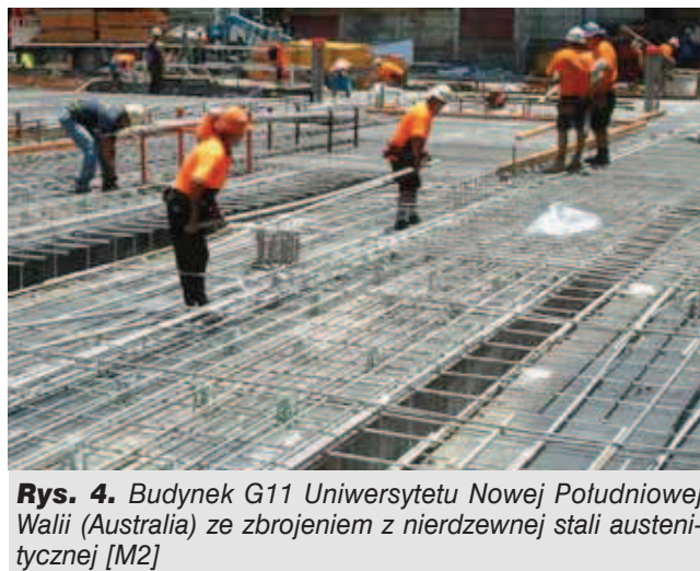
Rys. 4. Budynek G11 Uniwersytetu Nowej Południowej Walii (Australia) ze zbrojeniem z nierdzewnej stali austenitycznej [M2]

Przedstawiona w niniejszym artykule analiza wad i zalet stosowania stali nierdzewnej, jako zbrojenia konstrukcji betonowych, wskazuje na bardzo interesującą alternatywę dla typowej stali węglowej pod kątem wydłużenia trwałości żelbetu. Podstawową wadą stosowania stali nierdzewnej będzie zapewne wzrost kosztów inwestycji na etapie jej wykonania. Ale w perspektywie planowanej kilkudziesięcioletniej eksploatacji