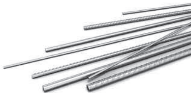
Rys. 1. Zbrojenie ze stali nierdzewnej [M2]

W podanej klasyfikacji rodzajów stali nierdzewnej o strukturze jednofazowej, obok stali austenitycznej i ferrytycznej często wymienia się stal martenzytyczną [N5]. Ma ona skład chemiczny porównywalny do stali ferrytycznej, ale między innymi