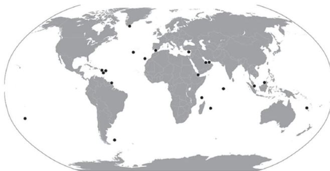
Rys. 1. Główne bazy morskie i inne obiekty morskie należące do państw członkowskich UE