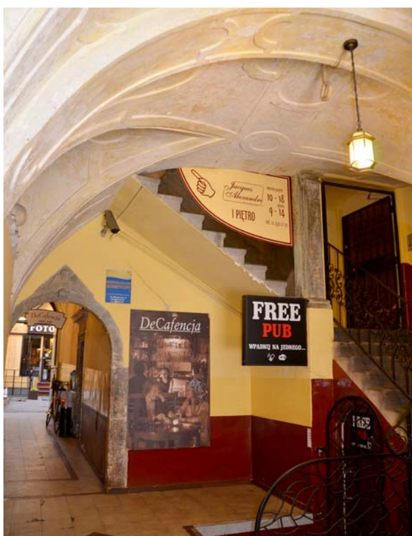
Ryc. 1. Kraków, sieni kamienicy, ul. Sławkowska 4 Fig. 1. Krakow, tenement entrance hall, 4 Sławkowska St.

the entrance hall to the Wielopolski palace (fig. 5), at 3–4 Wszystkich Świętych Square. The last among the mentioned entrance halls is of a different provenance, and is a part of a detached magnate residence 10 , not typical for burgher Krakow. All the aforementioned early-Baroque realisations have preserved until today practically without significant alterations (except the house at 22 Rynek Gł.), which resulted from the unchanging function of the buildings. Also nowadays the buildings are of residential character, or serve similar purposes (Municipal Office resides currently in houses at no 20, 27 Rynek Gł., at no 15 św. Jana Street, and at 3–4 Wszystkich Świętych Square). When entrance halls were arranged, they served the formal and reception purposes. Grand houses were models for those of the less wealthy classes. Therefore we can find imitations e.g. in the house at 4 Sławkowska St. where the vault in a small entrance house resembles one from