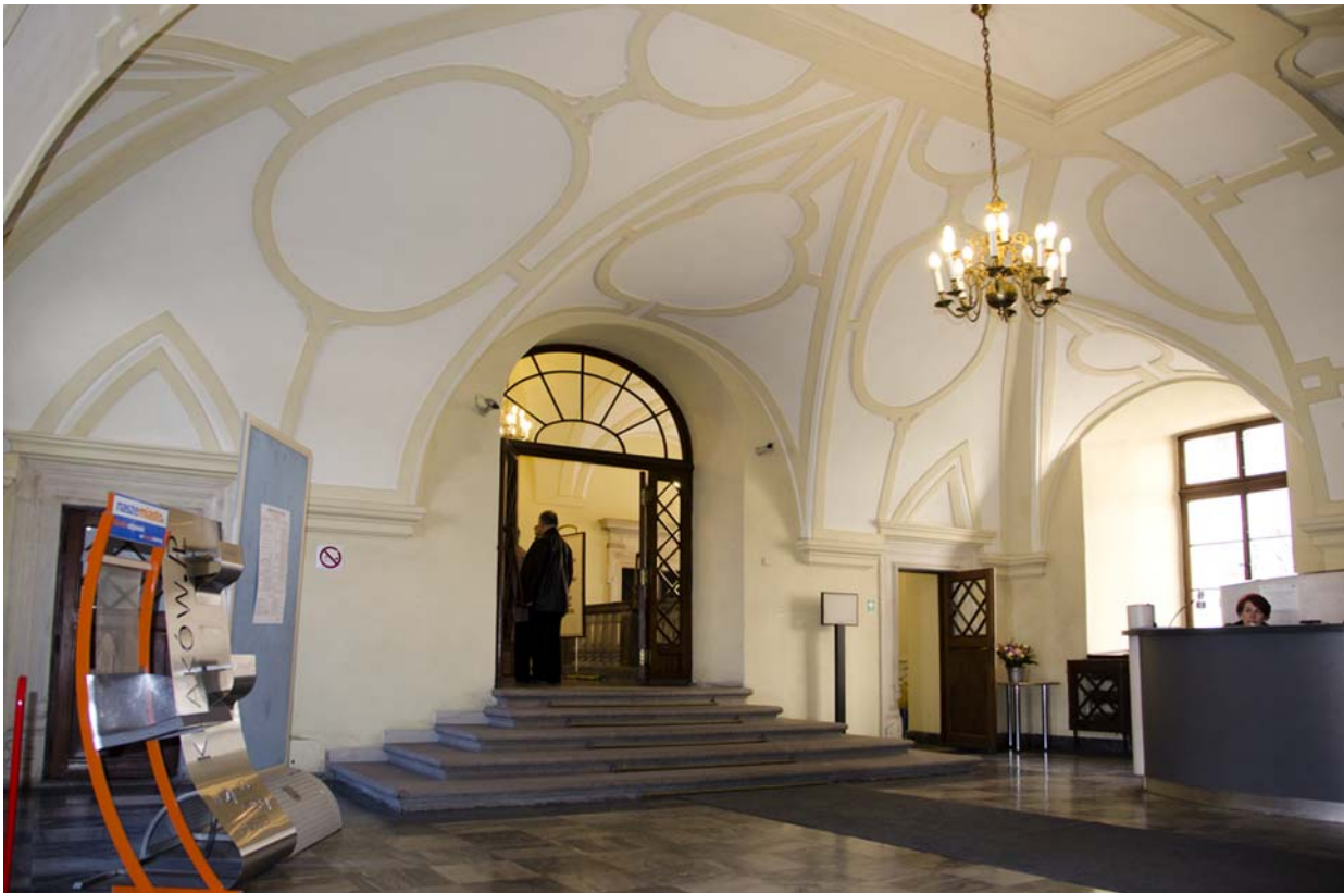
Ryc. 5. Pl. Wszystkich Świętych 3–4, sień pałacu Wielopolskich Fig. 5. 3–4 Wszystkich Świętych Sq., entrance hall of the Wielopolski palace