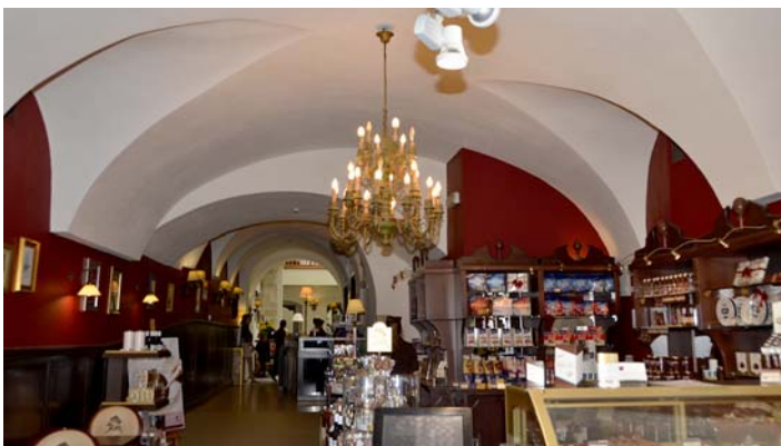
Ryc. 8. Rynek Gł. 46, sień kamienicy, obecnie adap. sklep „Czekolada” Fig. 8. 46 Rynek Gł., tenement entrance hall, currently adapted shop “Czekolada”