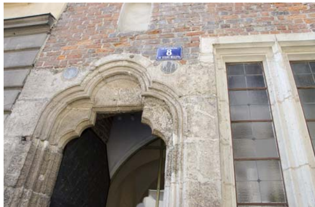
Ryc. 7. ul. Szpitalna 8 Fig. 7. 8 Szpitalna St.