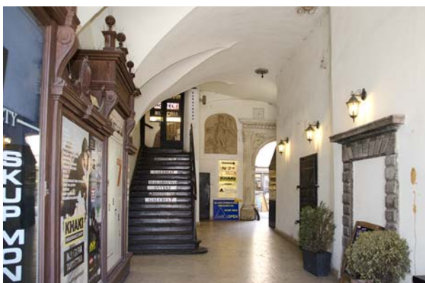
Ryc. 2. Rynek Gł. 7, sieni kamienicy Fig. 2. 7 Rynek Gł., tenement entrance hall