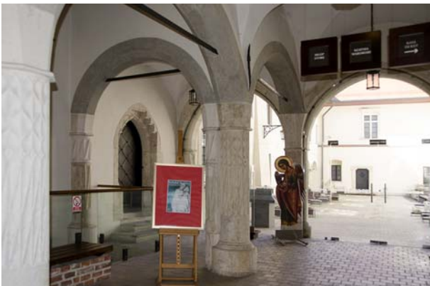
Ryc. 6. Sień pałacu biskupa Erazma Ciołka, Kanonicza 17 Fig. 6. Entrance hall of the Bishop Erazm Ciołek's palace, 17 Kanonicza St.