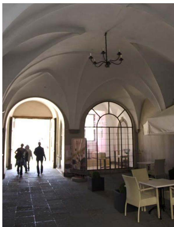
Ryc. 3. Rynek Gł. 27, sieni pałacu Pod Baranami Fig. 3. 27 Rynek Gł., entrance hall of the Pod Baranami palace