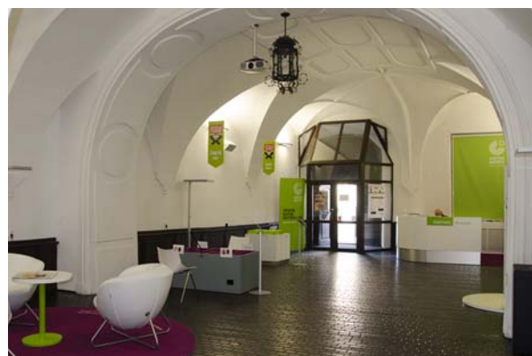
Ryc. 4. Rynek Gł. 20, sieni pałacu Zbaraskich Fig. 4. 20 Rynek Gł., entrance hall of the Zbaraski palace