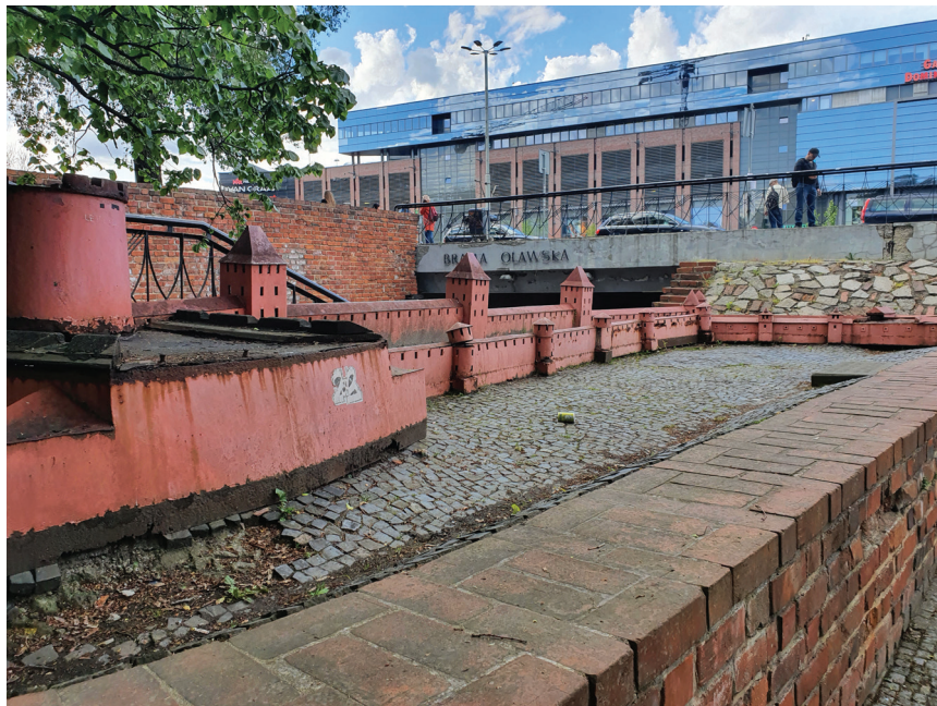
Fot. 1. Makietę systemu obronnego umieszczoną przy Bramie Oławskiej zewnętrznej. Relikty umocnień na pl. Wolności

W trakcie prac archeologicznych prowadzonych w latach 2007–2012 na obszarze placu Wolności odsłonięto relikty dwóch linii umocnień: pochodzącej z pierwszej połowy XIV wieku drugiej linii średniowiecznych murów obronnych oraz XV-wiecznej kurtyny systemu fortyfikacji bastiejowych [13]. Zdecydowano