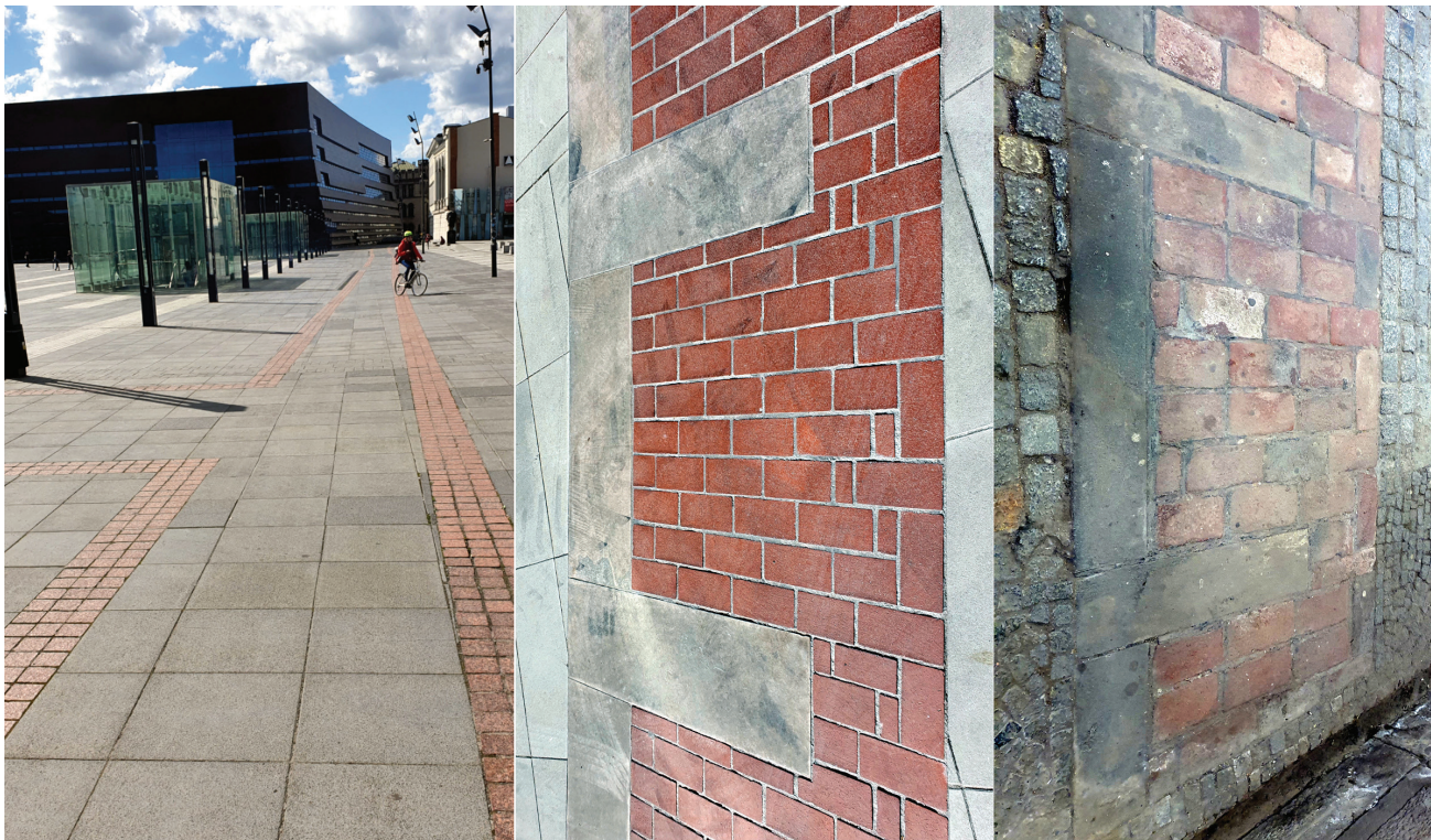
Fot. 3. Sposób prezentacji reliktów umocnień bastejowych. Od lewej: pl. Wolności, pl. Jana Pawła II, Brama Oławska zewnętrzna