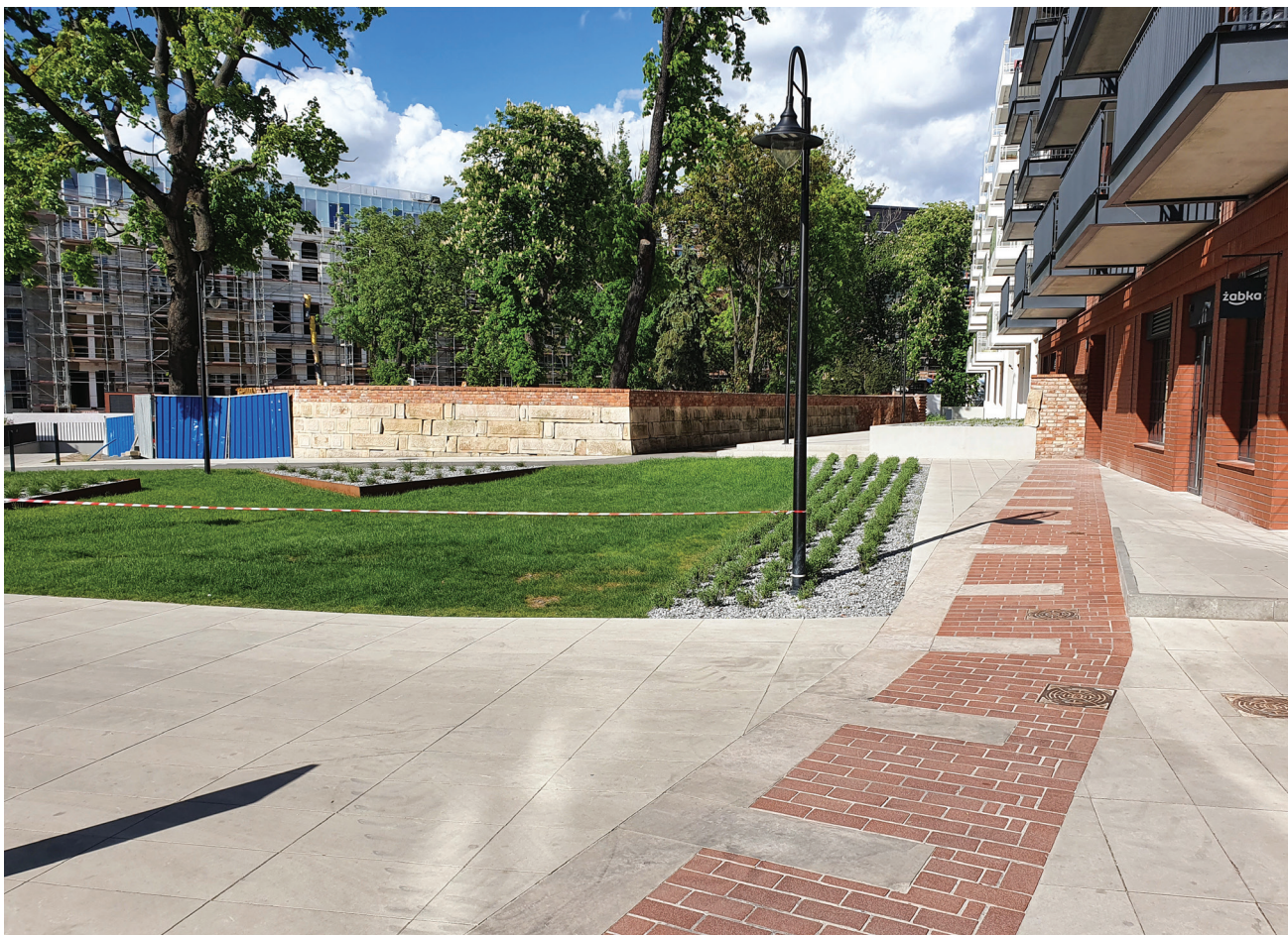
Fot. 2. Fragmenty ekspozycji przy pl. Jana Pawła II. W posadzce widoczny przebieg kurtyny umocnień bastejowych, na drugim planie mur ukazujący przebieg Bastionu Kleszczowego.

stion Kleszczowy został odsłonięty w trakcie prac wykopaliskowych w latach 2015–2020. Biorąc pod uwagę duży obszar objęty badaniami, bardzo zróżnicowany stan odnalezionych reliktyw oraz stopień skomplikowania prac, warunkowany głównie względami administracyjnymi i technicznymi [10], nie było możliwości wyeksponowania wszystkich odkryć in situ . Projektanci przyjęli więc mieszany system ekspozycji. Elementy istotne urbanistycznie, ale jednocześnie w najgorszym stanie technicznym, zostały przedstawione w formie zarysu w posadzce i na murach nowych obiektów. Obrys znacznej części południowego barku bastionu został wyeksponowany w formie muru z wykorzystaniem zachowanych elementów oryginalnej kamiennej oblicówki, ale podniesionego w stosunku do oryginału o około 3 metry. Stanowiący z kolei jedno z najciekawszych odkryć fundament wieży wraz z destruktem przylegających do niej murów wyeksponowano in situ . Bez przemyślanego systemu informacyjnego zespół ten może pozostać całkowicie niezrozumiały. Dodatkowo przeciętny zwiedzający niemal na pewno będzie miał problem z różnicowaniem między elementami oryginalnymi a rekonstruowanymi.