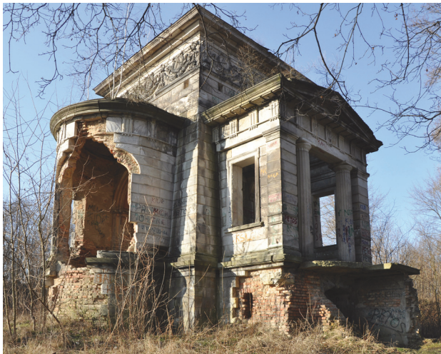
Il. 3. Grobowiec rodziny Samsona Wollera w Leśnej – widok od strony południowo-wschodniej, stan obecny