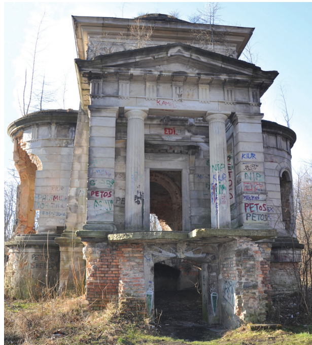
Il. 4. Grobowiec rodziny Samsona Wollera w Leśnej – elewacja frontowa, stan obecny