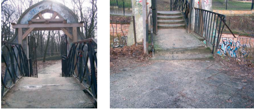
Fot. 3. Mostek nad dawną „Głęboką Drogą” w Puławach, 2016 r. a) brama portalowa i pomost, b) kamienne schody i chodnik na podejściu do mostku.

Nieznane jest posadowienie mostku, brak również informacji o występowaniu izolacji przeciwwilgociowych. Jako odprowadzenie wody z pomostu przewidziano podłużne spadki chodnika, dlatego prawdopodobnie większości wody odprowadzana jest bezpośrednio pod obiekt.