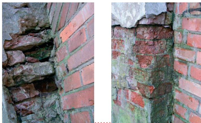
Fot. 4. Mostek nad dawną „Głęboką Droga” w Puławach, 2016 r. Miejsca połączeń ustroju nośnego mostku i muru oporowego. Zniszczenia cegły i zaprawy spowodowane przemarzaniem

nia kamiennych profili. Deformacje powierzchni, spękania i znaczne ubytki w kamiennych schodach i płytach spocznikowych, są spowodowane brakiem prawidłowego odwodnienia pomostu. Poprzez spadki nawierzchni woda odprowadzona jest bezpośrednio pod obiekt.