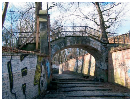
Fot. 2. Mostek nad dawną „Głęboką Drogą” w Puławach, 2016 r. a) widok ogólny b) widok z poziomu dawnej ul. Głębokiej.

Głównym elementem zdobniczym mostku jest brama portalowa ukształtowana w formie łuku i obejmująca jedną z podpór. Ceglana konstrukcję mostku pokrywają warstwy tynków i wymalowań [Fot. 2].