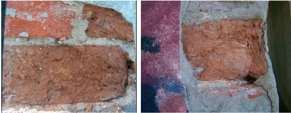
Fot. 5. Mostek nad dawną „Głęboką Drogą” w Puławach, 2016 r. Brama portalowa, zniszczenia cegły i spoiny spowodowane krystalizacją soli budowlanych