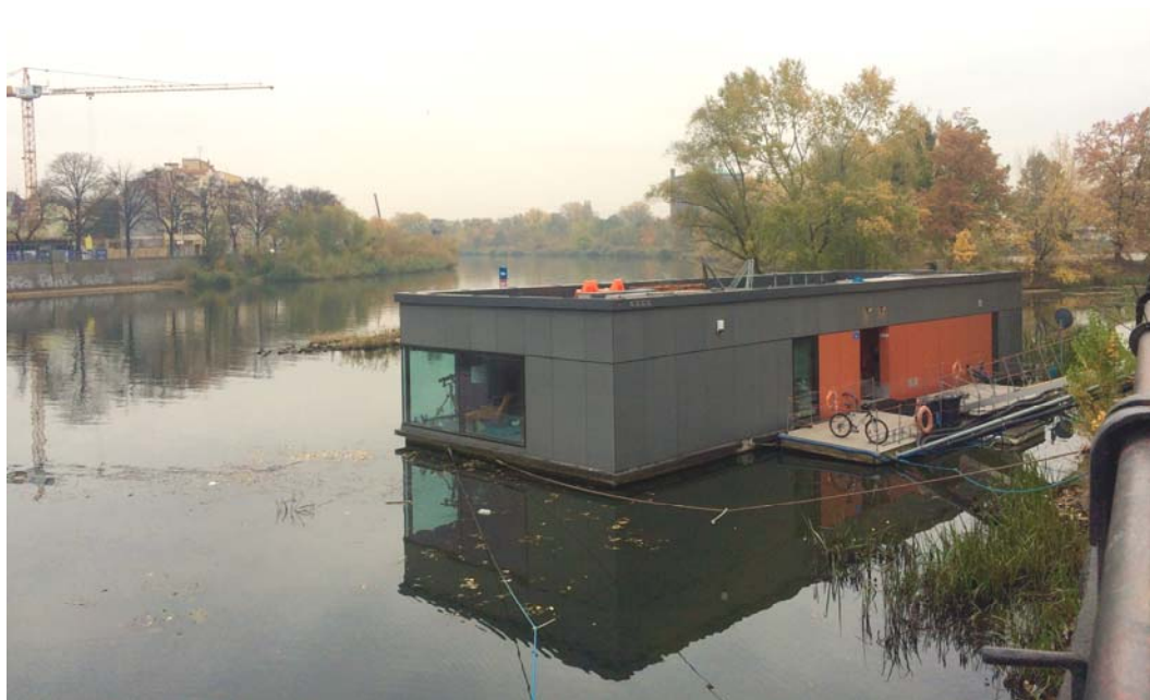
Ryc. 7. Dom na wodzie Kamila Zaremby.

Drugi we Wrocławiu dom na wodzie, liczący 75 m, został zaprojektowany przez pracownię Isola System, którą tworzą Wojciech Bartosiewicz i Alejandro Capdevilla. Obiekt zasilany jest panelami słonecznymi oraz wiatrakiem. Szacowany koszt budowy takiego domu to około 5–7 tys. zł/m 2 [5]. Jest to niemal dwukrotnie więcej niż w przypadku tradycyjnego budownictwa jednorodzinne, jednakże wciąż są to kwoty konkurencyjne z cenami mieszkań deweloperskich. Zainteresowanie taką formą zamieszkiwania z pewnością będzie rosło, biorąc pod uwagę zarówno trendy w Europie [8], jak i możliwości, jakie oferuje Odra. Obecnie jednak wciąż są to działania pionierskie, wymagające konfrontacji z zawiłościami formalnoprawnymi oraz niedostatkami infrastrukturalnymi. Niemniej wrocławskie domy na wodzie trwale wpisały się w krajobraz.