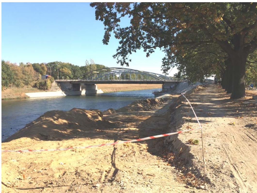
Ryc. 3. Przejście pod Mostami Jagiellońskimi w trakcie realizacji.

Projekt Ochrony Przeciwpowodziowej Doliny Odry jest efektem strategii przeciwpowodziowych, do których opracowania zmusiły skala oraz wielkość strat spowodowanych powodzią w 1997 r. 1 [23]. Modernizacja jest jedną z największych inwestycji hydrotechnicznych w Polsce, mającą na celu poprawę bezpieczeństwa powodziowego Wrocławia oraz miejscowości zlokalizowanych w bezpośrednim sąsiedztwie [18]. Projekt postanowiono podzielić na komponenty. W ramach Programu dla Odry powstaje suchy zbiornik przeciwpowodziowy Racibórz, o pojemności 185 mln m 3 , który realizowany będzie przez Regionalny Zarząd Gospodarki Wodnej w Gliwicach. Zakres działań Dolnośląskiego Zarządu Melioracji i Urządzeń Wodnych we Wrocławiu [30] postanowiono rozłożyć na dwa etapy ze względu na termin realizacji oraz możliwości wykorzystania środków finansowych.