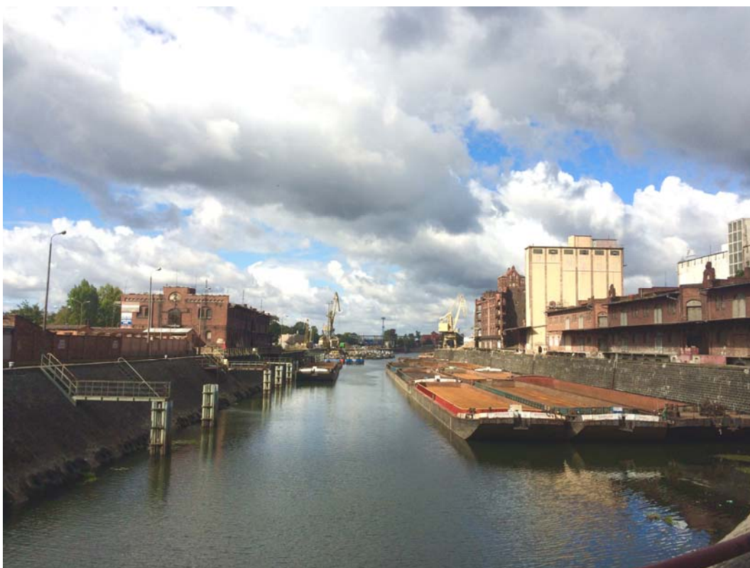
Ryc. 8. Port Miejski. Fig. 8. City Port.

walory przestrzeni nadrzecznych nie są w pełni wykorzystane. Jedynie dzięki odpowiednio zaprojektowanej przestrzeni można stworzyć miejsce skłaniające ludzi do interakcji, chęci przebywania z innymi, miejsce, z którym mieszkańcy będą się utożsamiali, a przechodnie będą się chętnie zatrzymywać i przebywać. W tym celu należy prowokować dyskusje, zachęcać do partycypacji społecznej 8 , organizować debaty, konfrontować zamierzenia miasta z oczekiwaniami lokalnej społeczności, skłaniać mieszkańców do wyrażania opinii i dopiero na takim gruncie podejmować decyzje projektowe.