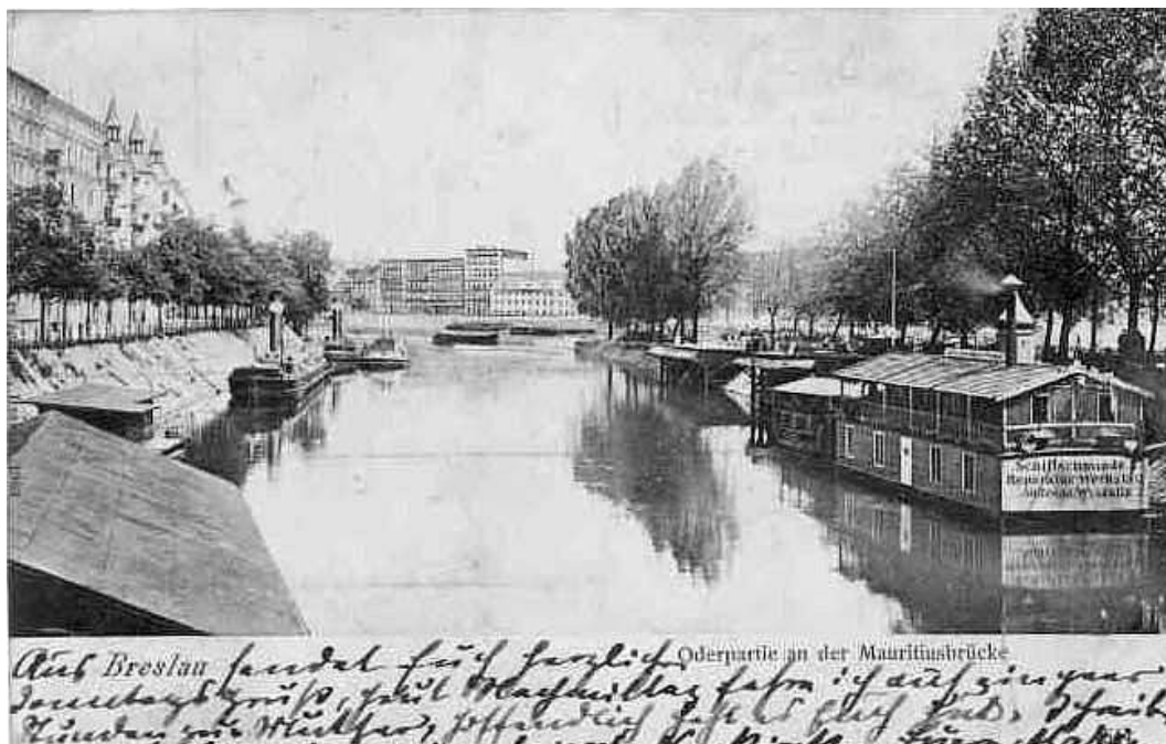
Ryc. 2. Zdjęcie archiwalne. Barki znajdujące się w rejonie ujścia rzeki Oława do Odry. Źródło: [27] Fig. 2 Archival figure. Boats located where Oława flows into Odra. Source: [27]

gdys w sposób spontaniczny powstawały miejskie plaże, gdzie ludzie tłumnie gromadzili się w ciepłe dni. Na Odrze i terenach nadrzecznych tętniło życie [27]. W obrębie Starego Miasta licznie kursowały i stacjonowały wszelkiego rodzaju jednostki. Pierwszy dom na wodzie we Wrocławiu pojawił się już w 1903 r. [14]. Lata powojenne to powolny proces odwracania się miasta do Odry – wynik m.in. krótkowzrocznej polityki przestrzennej, w której pomijano możliwości, jakie oferowała jej bliskość. Rola rzeki została zredukowana do źródła kruszyw oraz traktu komunikacji towarowej – funkcji z czasem wypartej przez kolej i transport samochodowy – po którym poruszały się nieliczne statki wycieczkowe. Istniejąca infrastruktura niszczała i popadała w zapomnienie, jak chociażby wyjątkowy zespół Portu Miejskiego.