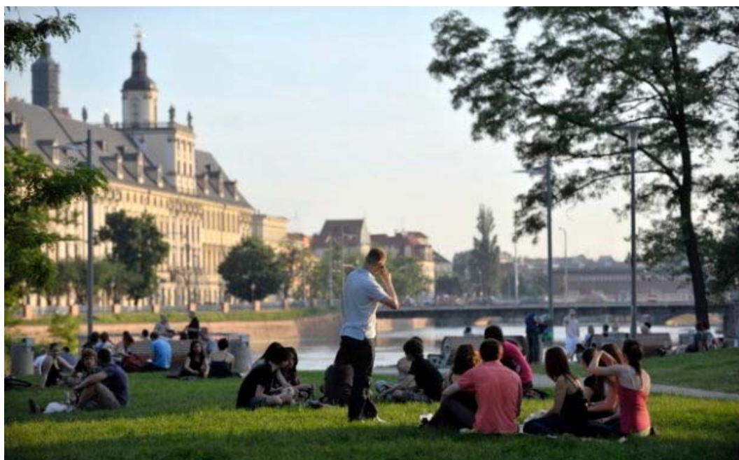
Ryc. 6. Wyspa Słodowa.

Wrocław słynie z wysp zlokalizowanych w samym centrum, wśród których dużą popularnością cieszy się, szczególnie wśród młodzieży, Wyspa Słodowa. Przez wiele lat była miejscem organizowania letnich koncertów i festiwali. Realizacja w 2003 r. dwóch kładek – Słodowej i Piaskowej – łączących ją z miastem poprzedziła gruntowną rewitalizację, której efektem było przekształcenie przestrzeni rekreacyjnej wzdłuż jej południowego brzegu, z widokiem na Gmach Główny Uniwersytetu Wrocławskiego. Zaprojektowano plac zabaw i układ ścieżek z punktami widokowymi oraz zejściami do wody. Dodatkową atrakcją jest funkcjonująca od 2014 r. Barbarka – cumujący w rejonie mostu Uniwersyteckiego klub na świeżym powietrzu, goszczący regularnie kameralne koncerty oraz imprezy muzyczne, swym nieformalnym charakterem oferujący nieco inny model spędzania wolnego czasu niż ekskluzywne lokale mieszczące się w pobliskiej Marinie Topacz.