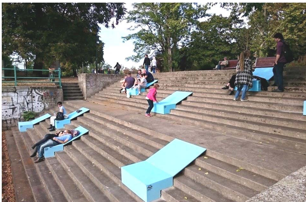
Ryc. 5. Mikroinstalacja autorstwa No Studio w pobliżu mostu Piaskowego. Źródło: [21]

Obie inwestycje, Kurkowa 14 i Dubois 41, również zostały zaprojektowane przez Pracownię Projektową Maćków. Pierwsza z nich to budynek mieszkaniowo-usługowy, zrealizowany w 2014 r. Projekt obejmuje kwartał zabudowy mieszkalnej, otwierającej się na rzekę. Dziedziniec zabudowy został wyniesiony na poziom +1, dzięki czemu następuje subtelna separacja przestrzeni na publiczną i półprywatną. Dubois 41 to oddany w 2015 r. obiekt biurowy z przyziemiem bezpośrednio otwierającym się na bulwar. Należy wspomnieć również o osiedlu Olimpia Port zaprojektowanym i realizowanym przez grupę Archicom, który jest wieloetapowym założeniem urbanistycznym, położonym w północno-wschodniej części Wrocławia, zmieniającym dotychczasowy, przemysłowy charakter terenu na funkcję mieszkaniową, otwierając tereny te na Odrę. Wzdłuż kanału zlokalizowano bulwar i ścieżkę rowerową, a nad samą wodą pojawiły się pomosty i barki. Do mniejszych inwestycji, lecz odgrywających ważną rolę w aktywizowaniu przestrzeni nadwodnych należy zaliczyć działające w okresie letnim plaże miejskie.