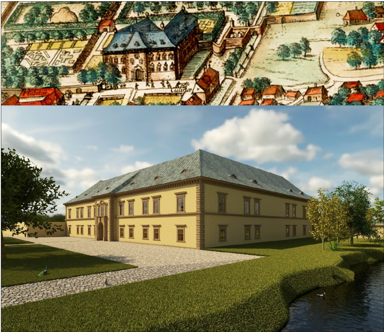
Ryc. 4. Rekonstrukcja bryły pałacu w Łobzowie po przebudowie Władysława IV Wazy, ostatniej znanej formy pałacu sprzed szwedzkiej zniszczeń, oraz jej porównanie z przedstawieniem obiektu na Panoramie Krakowa z dzieła Civitates orbis terrarum