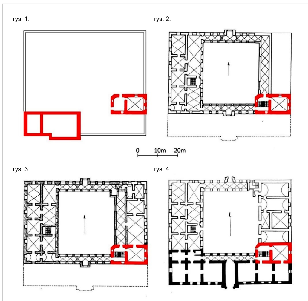
Ryc. 1. Zestawienie przebudów pałacu w Łobzowie: rys. 1 – fortalicjum Kazimierza Wielkiego, rys. 2 – rozbudowa Santi Gucciego na zlecenie Stefana Batorego, rys. 3 – rozbudowa Zygmunta III Wazy (prawdopodobny autor projektu: Santi Gucci), rys. 4 – przebudowa Giovanniego Trevano, na czerwono oznaczono przypuszczalną lokalizację pozostałości po gotyckich murach z czasów Kazimierza Wielkiego; autor: P. Pikulski na podstawie materiałów opracowanych przez D. Długosz, E. Furlepę, A. Jurek, Ł. Kadęła, A. Steuer-Jurek (studia doktoranckie 2014/15 pod kierownictwem prof. A. Kadłuczki) oraz prac W. Kieszkowskiego i J. Zachwatowicza.