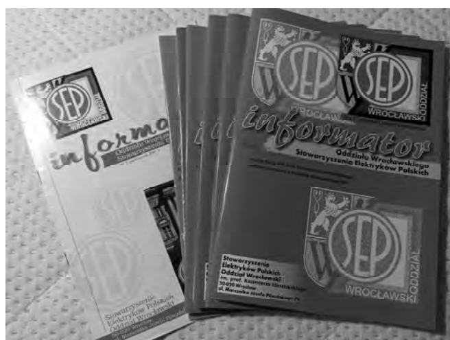
Rys. 3. Informatory wydawane od 2001 r.

W każdym numerze Informatora począwszy od nr 1 aż po bieżący numer stałą pozycję zajmują: Słowo prezesa Wrocławskiego Oddziału SEP, Od redakcji, Kalendarium wydarzeń, artykuły okolicznościowe, Wyniki konkursu na najlepsze Koło SEP w danym roku, Wyniki konkursu na najlepsze prace dyplomowe na wydziałach: Elektrycznym, Elektroniki, Podstawowych Problemów Techniki i – nieco później – na Wydziale Elektroniki Mikrosystemów i Fotoniki, Wykaz osób uhonorowanych różnego rodzaju medalami i wykaz Kolegów, którzy od nas odeszli w danym minionym roku. W kolejnych numerach pojawiały się działy: Z życia Oddziału , kół i sekcji , opisy wycieczek organizowanych przez Oddział i artykuły związane z historią kół . Przeciętna objętość numeru to ok. 30 stron. Rekordzistą jest nr 21, którego objętość wyniosła 48 stron.