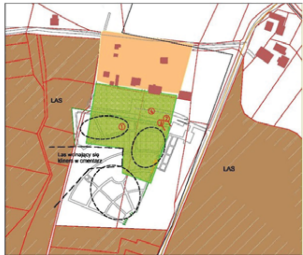
Il. 6 Schemat cmentarza komunalnego w Tychach (opracowanie G. Lasek) Legenda: 1. cmentarz; 2. brama wejściowo-wjazdowa na cmentarz; 3. krzyż; 4. parking.

Ostatnim prezentowanym miejscem pochówku jest cmentarz komunalny w Tychach przy ulicy Barwnej założony na przedmieściach na przełomie XX i XXI wieku. Otoczony jest lasami pszczyńskimi. Dostępny jest od strony wschodniej, poprzez zjazd z drogi prowadzonej wzdłuż nekropoli. W sąsiedztwie głównej bramy wejściowo-wjazdowej zrealizowano parking. Miejsce lokalizacji nie posiada kontekstu sakralnego. Działka nekropolii wpisuje się w kształt nieregularnego prostokąta, w który – w sposób centralny – klinem wbija się niewielki las. Układ ścieżek zakomponowano w kształt wachlarza. Wydzielono w ten sposób kwatery na nagrobki. Niestety miejsce, w którym zbiegają się główne dojścia nie pokrywa się z lokalizacją głównej strefy wejściowej. Niepodkreślony dominantą punkt kulminacyjny dla układu ścieżek tworzących wachlarz znajduje się po przeciwnej stronie głównej strefy wejściowej. Zarazem obydwie zlokalizowane są w narożnikach wschodniej granicy parceli. W obrębie głównej strefy wejściowej zlokalizowano krzyż. Na niekorzystny odbiór nekropolii w szczególności wpływa układ kompozycyjno – przestrzenny nienawiązujący do stref dostępu i miejsc formalnie ważnych, brak sakralnego charakteru, niewystarczająca ilość zieleni. (Il. 6)