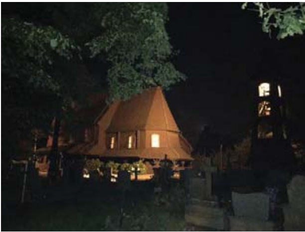
Il. 1 Oświetlenie kościoła parafialnego pw. Św. Barbary, dzwonnicy oraz cmentarza we wsi Góra.

Il. 1 Illumination of the parish church under the invocation of St. Barbara with bell tower and cemetery in Góra.