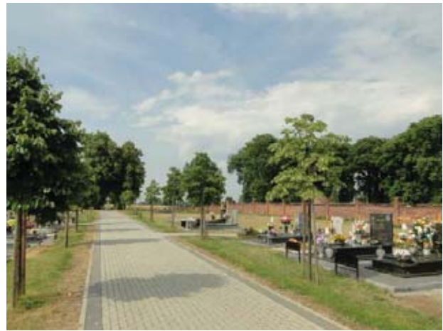
Il. 3 Widok cmentarza w Złotogłowicach. Jedna z głównych alej widoczna w całości. Druga aleja, zlokalizowana za murem rozdzielającym działkę, zaakcentowana jest układem drzew.

Nekropolia położona jest na uboczu, za linią zabudowań i ogrodów przydomowych. Dostęp zapewniają drogi dojazdowe oraz ciąg pieszo – jezdny prowadzony od placu przykościelnego, wzdłuż działki przeznaczonej na funkcje sakralne i świeckie. W rozwiązaniu czytelny jest podział na dwa makro wnętrza – współczesne i historyczne, rozdzielone ceglany