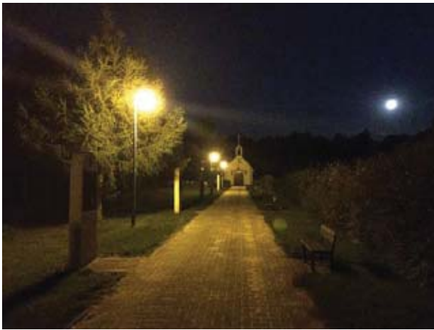
Il. 5 Widok oświetlenia prowadzącej na cmentarz alei, stacji drogi krzyżowej oraz kaplicy w Ławkach.