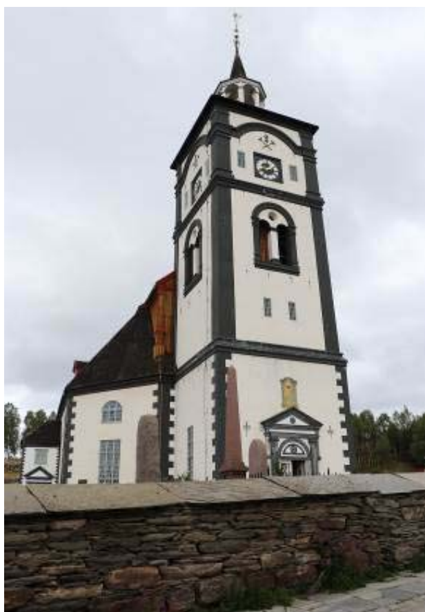
Il. 8. Widok na kościół od strony południowej.