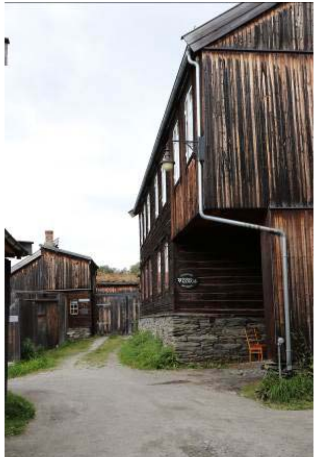
Il. 5. Zabudowa z tyłu pierzei ulicy Kjerkgata. Widok od południa.