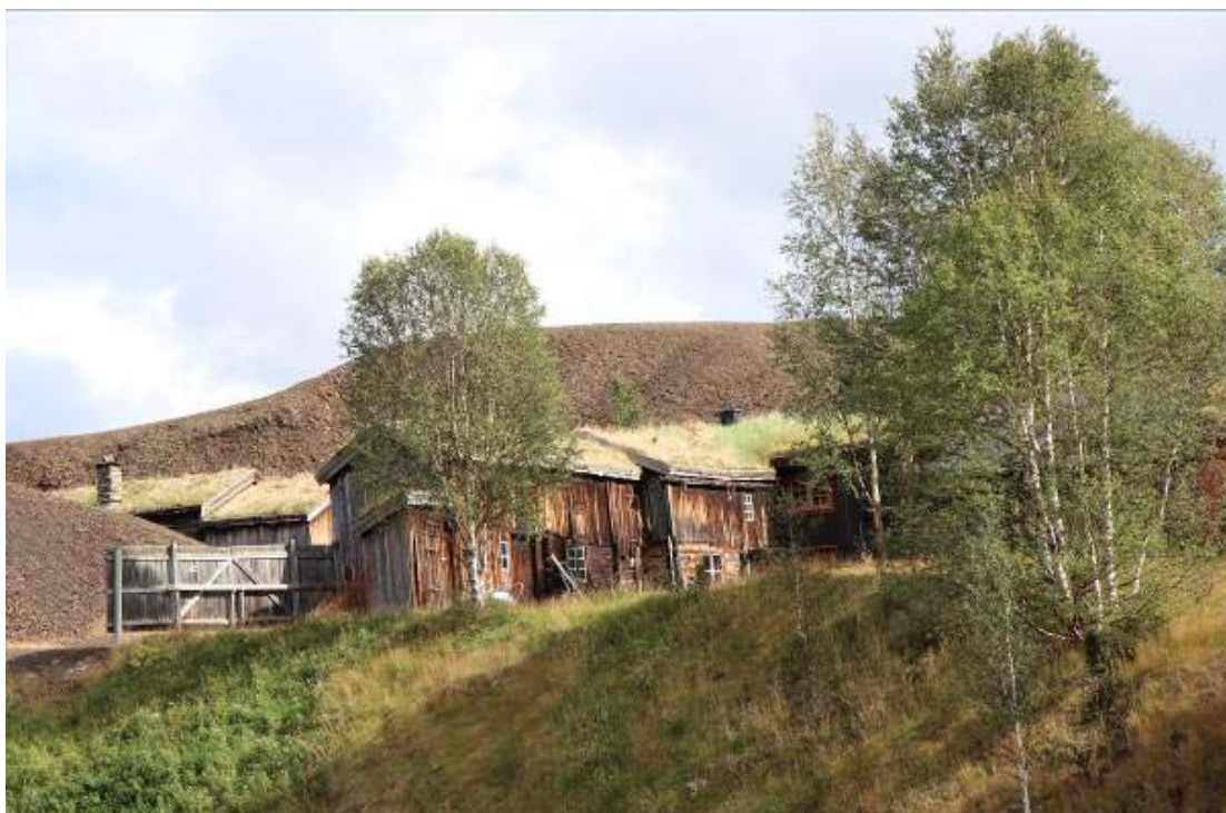
Il. 7. Widok na budynki mieszkalne, będące częścią Muzeum Smelhytta.