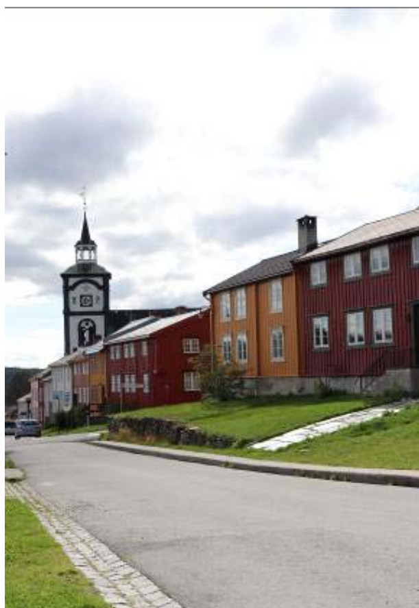
Il. 9. Widok na kościół od strony wschodniej.