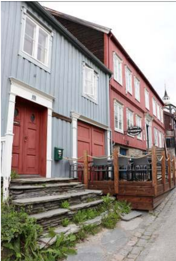
Il. 4. Zabudowa frontowa przy ulicy Kjerkgata. Widok od południowego-zachodu.