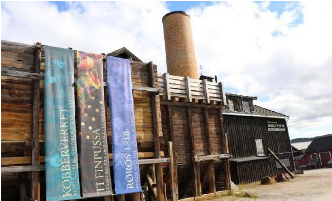
Il. 6. Widok na główny budynek dawnej huty, w którym zlokalizowane jest Muzeum Smelhytta.