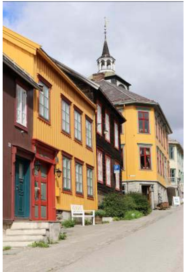
Il.2. Widok na zabudowę głównej ulicy, od zachodu.