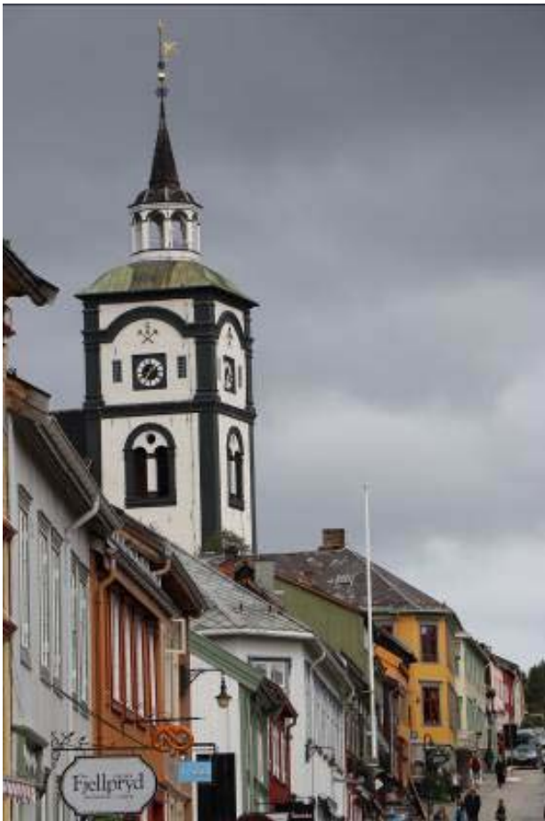
Il.1. Widok na wieżę kościoła parafialnego w Røros oraz na zabudowę głównej ulicy, od zachodu.