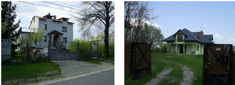
Fot. 4 a i 4b. Park Krajobrazowy Wzniesień Łódzkich. Nowe domy na terenie wsi Kalonka (negatywne przykłady).

przestrzeni polskiej wsi, ze wskazaniem na samorządy gminne i właściciela-użytkownika gruntu (kłopotliwa dla krajobrazu nadinterpretacja prawa własności) (fot. 4 a i 4 b).