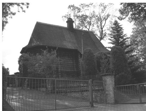
Fot. 3. Trybsz. Drewniany kościół pw. św. Elżbiety Węgierskiej z 1597 r. (fot. B. Wycichowska).

Szczególne znaczenie ma przeprowadzanie studiów krajobrazowych dla miejsc eksponowanych, o dużych wartościach kulturowo-przyrodniczych, które wymagają szczególnej dbałości przy komponowaniu ich bliskiego i dalszego otoczenia (zapewnienie maksymalnej ekspozycyjności głównego motywu widoku z wyznaczonych miejsc) (fot. 3).