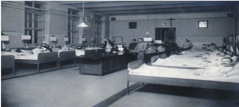
Rys 5. Męska sala chorych w czasie I Wojny Światowej.