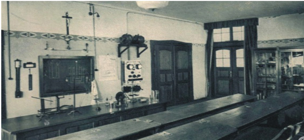
Rys 4. Dawna sala do nauki fizyki w klasztorze Urszulanek w Lubomierzu

znaczeniu kulturotwórczym, z którymi lokalna ludność chętnie się identyfikuje. Otwarcie obiektów klasztornych dla świeckich użytkowników nierozzerwalnie wiąże się z ich społecznym oddziaływaniem. To pole bardzo szerokie i niewątpliwie trudne do precyzyjnego zdefiniowania. Już sama obecność zakonników i obiektów przez nich budowanych w średniowiecznych miastach, oddziaływała na społeczeństwo i wymuszała konkretne zachowania społeczne. Konsekwencją tego było wprowadzenie i ukształtowanie lokalnej estetyki społecznej. Niewątpliwie, dominujące nad zabudową świecką założenia klasztorne były urzeczywistnieniem odwiecznego dążenia do trwałości i piękna w architekturze. Dla lokalnej ludności stanowiły niedościgniony wzór, zarówno w zakresie innowacyjnych rozwiązań konstrukcyjnych, ale także w zakresie formy, detalu czy zdobnictwa. Klasztory i obiekty sakralne były także miejscami, w których ludność obcowała z dziełami sztuki malarskiej czy rzeźbiarskiej, wykonanymi nierzadko przez znakomitych artystów 19 sprowadzanych przez zakonników. 20