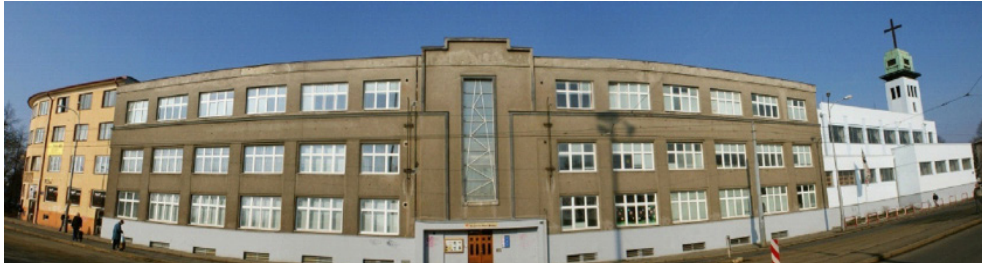
Rys 2. Widok budynku instytutu salezjańskiego (salezjańskiego centrum), kościoła (po prawej) i budynków klasztornych w Ostrawie (po lewej)

Fig 2. Salesian institute building view (Salesian center), the church (right) and buildings of the monastery (left) in Ostrava.