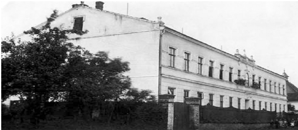
Rys 1. Frontowa, piętnastoosiowa fasada klasztoru Dominikanek w Klimowicach, fotografia z 1926 roku; centralnie widoczna nisza zamiast okna

Analizując architekturę klasztorów pamiętać należy o tym, że różnorodność misji duchowej zakonów odzwierciedla się w różnorodności form ich siedzib. Na analizowanym obszarze występują tylko zgromadzenia wspólnotowe, stąd pokrewieństwo dyspozycji przestrzennej ich siedzib jest oczywiste i czytelne. Wraz z upływem czasu, a więc zmieniającymi się wymogami i możliwościami, każdy ustalony typ zabudowań klasztornych ulega jednak pewnym modyfikacjom. Należy także mieć na uwadze fakt, że wspólnotowy charakter mają także kongregacje, które w przeciwieństwie do zakonów nie wykształciły skryzalizowanych typów zabudowań. Kształt wznoszonych przez nie zabudowań wynika bowiem raczej ze względów użytkowych, niż narzuconej im odgórnie formy 4 . Ponadto pamiętać należy o tym, że obszar Śląska Cieszyńskiego i Księstwa Opawskiego rozwijał się dynamicznie, a wielokulturowe, tolerancyjne społeczeństwo akceptowało i nadal akceptuje różnorodność zabudowy, kładąc przede wszystkim nacisk na jej użyteczność.