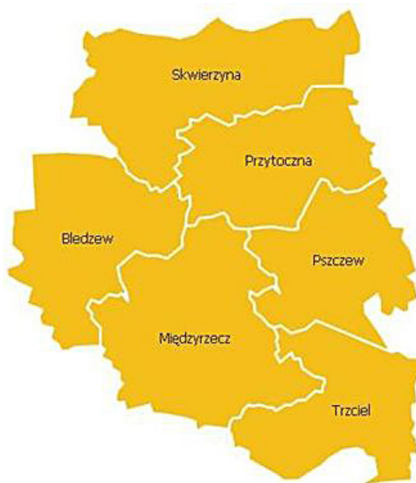
Rys. 1. Teren działania Inspektoratu Międzyrzecz